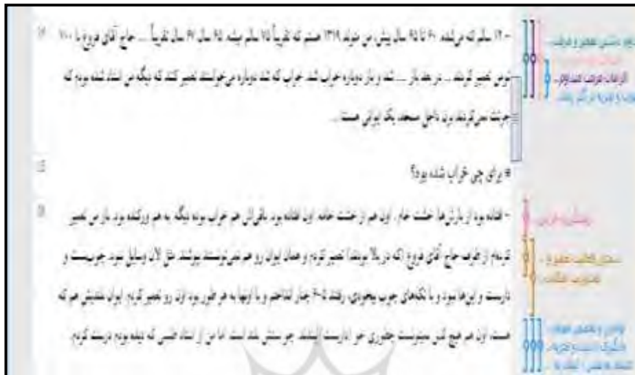
تصویر ۲- کُدگذاری اولیه در نرم‌افزار MaxQda