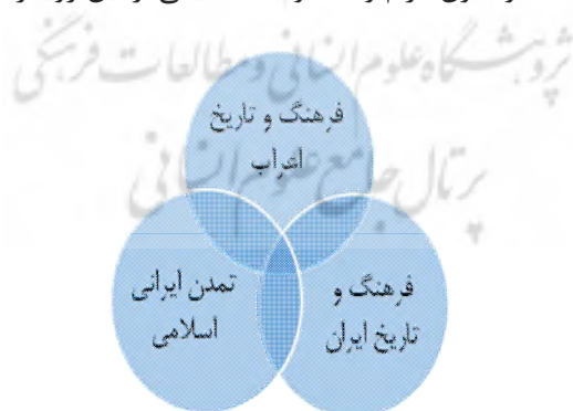
شکل ۱- محورهای سه‌گانه چارچوب استقرایی پژوهش

از دید "الگ گرابار" ۱ ، شهر اسلامی، کمتر به صورت یک موجودیت اجتماعی و فیزیکی تعمدی، آگاهانه و اصطلاحاً برنامه‌ریزی شده تعریف شده است. وی معتقد است این شهر مجموعه‌ای است از تنش‌ها در میان قطب‌های مختلف و بعضاً یکسره ناسازگار که همیشه در معرض متغیرهای زمان و مکان بوده‌اند. باین‌حال، این تنش‌ها دارای انعطاف‌پذیری نیز بوده‌اند (گرابار، ۱۳۹۰: ۴۴-۴۶). بر طبق نظریه جامعه ایرانی نیز، جامعه ایرانی؛ نه پدیده‌ای تھی رو به انحطاط است و نه امری متزاحم و متفرق و در عوض جامعه‌ای متکثر و تاریخی است. باین‌حال طبق آن نظریه؛ جامعه ایرانی، پدیده‌ای ناشناخته با مطالعاتی اندک در این زمینه معرفی شده است که تاکنون از دریچه سیاست و قدرت صرف به تحلیل آن پرداخته‌اند. فهم از آن نیز بیشتر، یک بیانیه سیاسی است تا یک تحلیل و فهم علمی. در مقابل؛ آن نظریه در جهت شناخت بنیادهای فکری جامعه ایرانی، توجه ویژه‌ای به تحولات اجتماعی نقش‌آفرین در شکل‌گیری نیروهای اجتماعی و پذیرش حیات اجتماعی جامعه دارد (آزاد ارمکی، ۱۳۹۱: ۳۶۸-۴۰۱). در مجموع، مطابق با این مبانی نظری؛ «شهر ایرانی اسلامی» از نگاهی بیرونی در سه مرحله اثرپذیر «تاریخ و فرهنگ اعراب»، «فرهنگ و تاریخ ایران» و «تمدن ایرانی اسلامی» به صورت یک زنجیره متعامل و پویا بررسی می‌شود. همچنین مطابق با این چارچوب نظری می‌توان مؤلفه‌های بنیادین را با رویکردهای مختلف سیاسی، الزام اجتماعی و رویکردهای اجتماعی- مکانی در شهر اسلامی (علیزاده و حبیبی، ۱۳۹۰) و بدون الزام و محدودیت به یکی از این رویکردها ردیابی کرد.