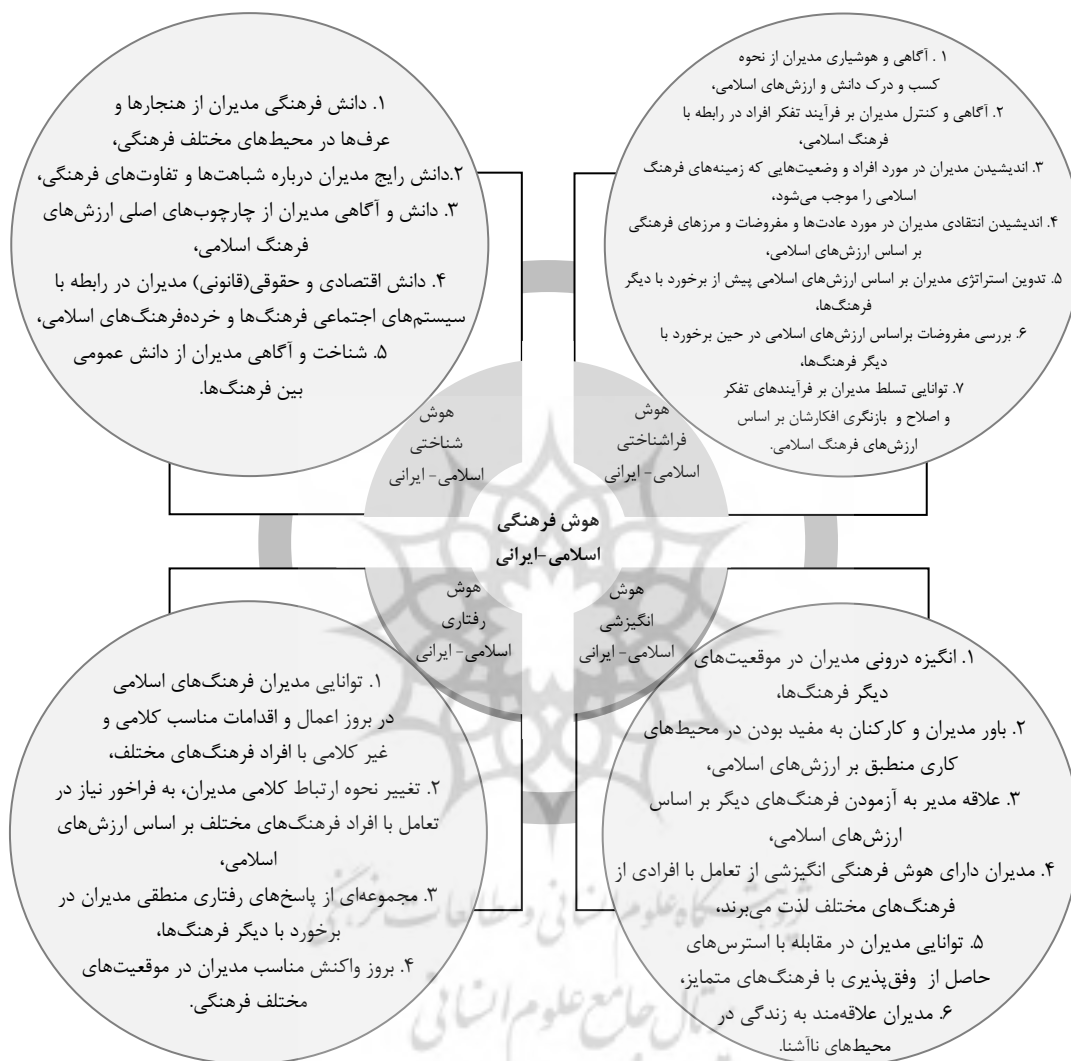
شکل شماره ۲: چارچوب نظری پژوهش