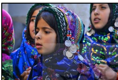
تصویر ۱۰: چنگه پول، روستای کنشت

این سربند را بیشتر عروس و زنان شرکت‌کننده در مراسم عروسی در کلات نادر بر سر می‌کنند (تصاویر ۹-۱۰) (همان).