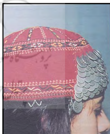
تصویر ۱۱: کلاه دختر خردسال (امیدی، ۱۳۸۲: ۲۵)

بر حاشیه کلاه، چنگه و پیش‌سینه بهاره اغلب سکه‌هایی را که در دسترس است، می‌دوزند و برای این منظور، یا حلقه‌ای به آن جوش می‌دهند و حلقه را به لباس می‌دوزند و یا سکه‌ها را سوراخ می‌کنند و طوری می‌دوزند که سوراخ ردیف‌های قبل با دخت بعدی پنهان شود. در صورتی که از سکه‌های قدیمی و نقره برای این منظور استفاده شود، به آن حلقه‌ای جوش می‌دهند تا سکه آسیب نبیند. این فن را