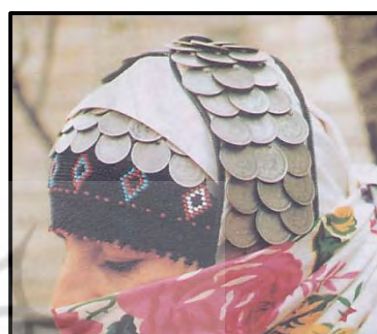
تصویر ۹: چنگه پول، کلات نادر (امیدی، ۱۳۸۲: ۲۸)

بر دور کلاه دختران خردسال نیز سکه‌هایی برای تزیین دوخته می‌شود (تصاویر ۱۱).