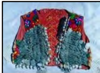
سی خمه - جلیقه