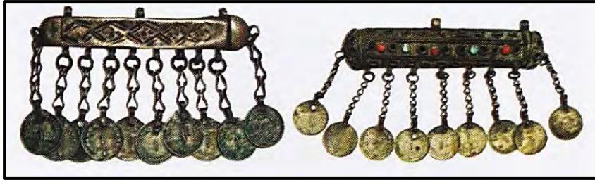
تصویر ۵: هیکل، موزه مردم‌شناسی بندرعباس (صفا ایسینی، ۱۳۸۹: ۱۵۴)

کچاچه: به سکه‌های تزیین شده دور لچک می‌گویند. در وسط این لچک نیز ماهک قرار می‌گیرد (تصویر ۶) (همان: ۱۸۲).