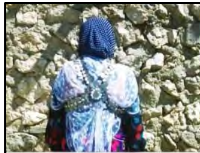
ناوشانی (زیور آلات زنان کرد)