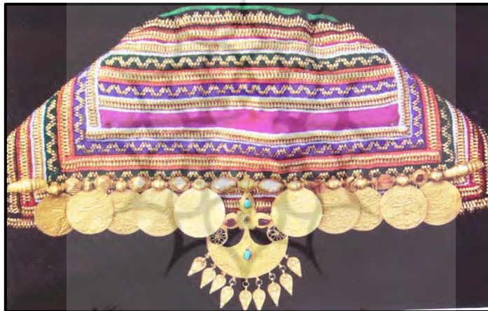
تصویر ۶: لچک با کچاچه (صفا ایسینی، ۱۳۸۹: ۱۸۲)

کچاچه: به سکه‌های تزیین شده دور لچک می‌گویند. در وسط این لچک نیز ماهک قرار می‌گیرد (تصویر ۶) (همان: ۱۸۲).