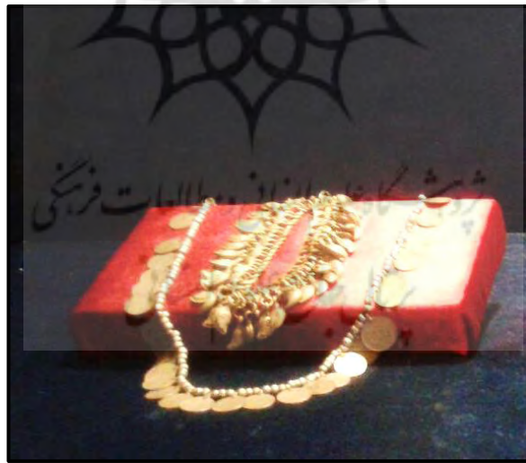
تصویر ۲: گردن‌بند سکه، موزه برج آزادی تهران