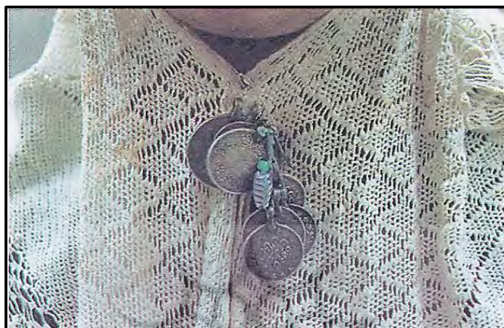
تصویر ۱۲: بیرجند (امیدی، ۱۳۸۲: ۱۴۱)

پول‌دوزی می‌نامند. در بیرجند نیز از سکه به شیوه‌های مختلف برای ساخت زیورآلات و نیز تزیینات و ملزومات پوشاک استفاده می‌شود (تصویر ۱۲).