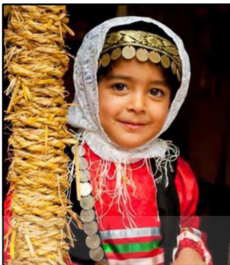
تصویر ۱۴: سکه در پوشاک زنان گیلان