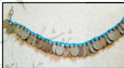
آویز سکه، کردستان

تصویر ۱۳: تصاویر سربند، جلیقه، ناوشانی و آویز سکه