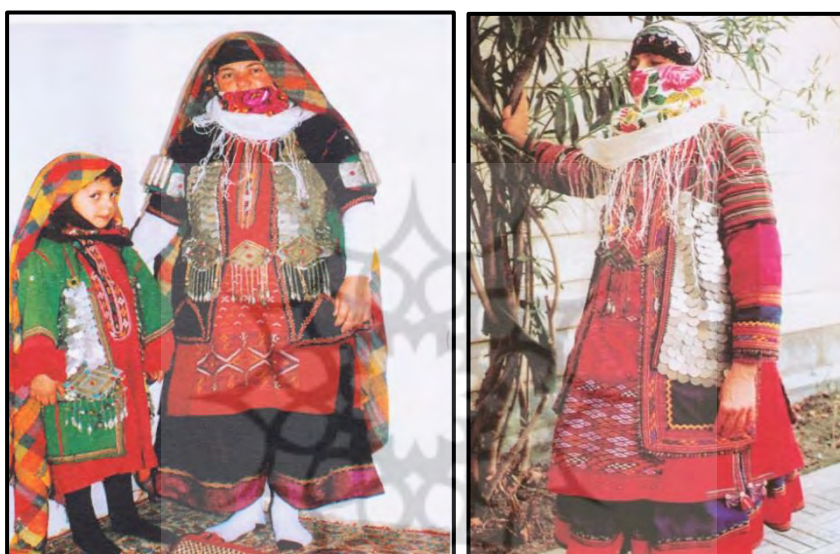
تصویر ۸: یخه پول، کلات نادر

البته برحسب طبقه اجتماعی و میزان ثروت خانواده، جنس و تعداد این سکه‌ها متفاوت است برای مثال، اگر عروس از طبقات ثروتمند باشد، از سکه‌دوزی و زیورآلات نقره در لباس خود استفاده می‌کند. به طور معمول، زنان میانسال و مسن‌تر که تکه‌های سکه‌دوزی شده را روی لباس خود دارند، آنها را به رسم امانت به جوان‌ها می‌دهند» (امیدی، ۱۳۸۲: ۲۲ - ۲۱).