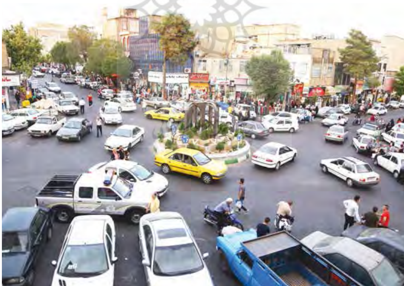
تصویر ۲: میدان برادران پاک‌دامن، محله شمیران نو.

«...» همیشه شبا می‌ریم تو اون مسجد، خیلی هم خوبه. چهارشنبه‌سوری می‌شه، جرأت نمی‌کنی بری سر میدون. فک