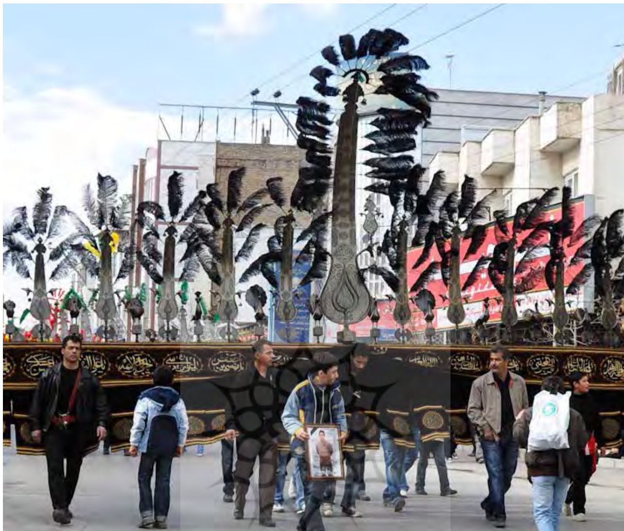
تصویر ۴: دسته‌های عزاداری در شمیران نو. عکس: امید جعفرنژاد، ۱۳۹۳.

هم‌محلی‌های خود را می‌بینند و تشکل‌های مذهبی و اعتقادی برگزار می‌کنند. در پاسخ به سؤال فرعی که این ساکنین چه بخشی از محله را مرکز می‌دانند می‌توان به پیشینه و قدمت مرکزیت محله و تاریخچه کالبدی آن اشاره کرد. هسته مرکزی توسعه محله و مرکز تأمین آب خانوارها هرچند تغییر ماهیت و شکل داده است، اما همچنان مزیت کارکردی و ماهیتی خود را از دست نداده است. به عبارتی در هر دوره زمانی این مرکز نقش‌های کارکردی متفاوتی را بر عهده گرفته است که تجمع ساکنین را در پی داشته و به فراخور نیازهای اجتماعی کانون تجمعات محله بوده است. مرکز دسترسی به آب، مرکز تجمعات انقلابی، مرکز رویدادهای مذهبی-فعالیت‌های اقتصادی، مرکز خرید و فروش و مرکز رفت‌وآمد و دسترس‌پذیری چیزی است که در سیر تکامل محله قابل مشاهده است. جای توجه دارد که در شرایط حاضر سه مؤلفه