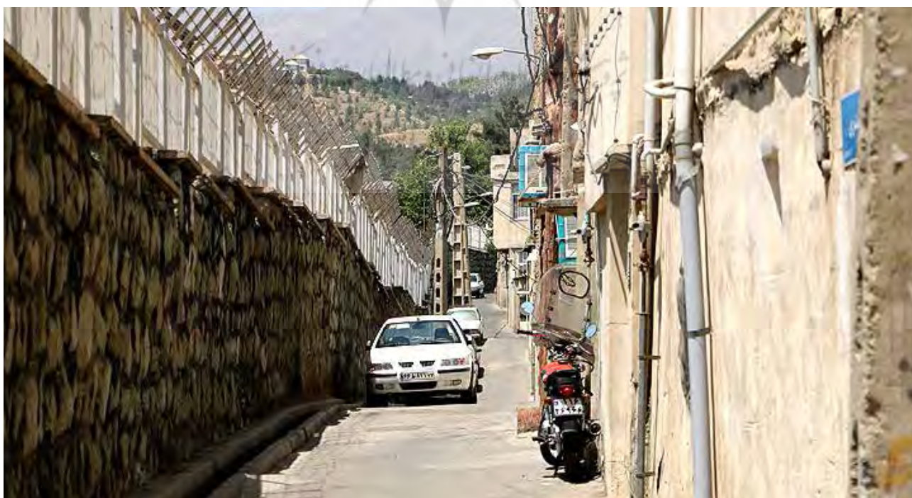
تصویر ۱: شمیران‌نو، نمادی از یک محله غیررسمی.

وقتی صحبت از یک محله غیررسمی است، مفاهیمی مثل مهاجرت، سکونت ناپایدار و تغییرات عدیده کالبدی و اجتماعی تداعی می‌شود. وقتی این محله در درون بافت شهری قرار دارد، موضوع تراکم بالا، کیفیت پایین زندگی در کنار مهاجرت‌های درون‌شهری از جمله خصوصیات قابل مشاهده است (ایراندوست، ۱۳۸۸: ۷۸)؛ (تصویر ۱). در مقابل، منظر لوحی است برای روایت از دست‌نوشته‌های تاریخی به‌جای‌مانده از خاطرات مردم بر محیط شهر و وقتی موضوع به محله پرتراکم و کم‌کیفیت غیررسمی وارد شود، پیچیدگی‌های زیادی در آن ظهور می‌کند. نکته قابل تأمل اینکه، به واسطه خصوصیات این‌گونه از محلات، گروه‌های اجتماعی متفاوتی با عناوین مختلف در آن ساکن و مشغول به ساخت‌وسازند. گروه‌هایی که با انگیزه‌ها، توانایی‌ها و تمایلات متفاوت، نگاه‌های متفاوتی نسبت به محله غیررسمی دارند و عملاً منظر متفاوتی از آن