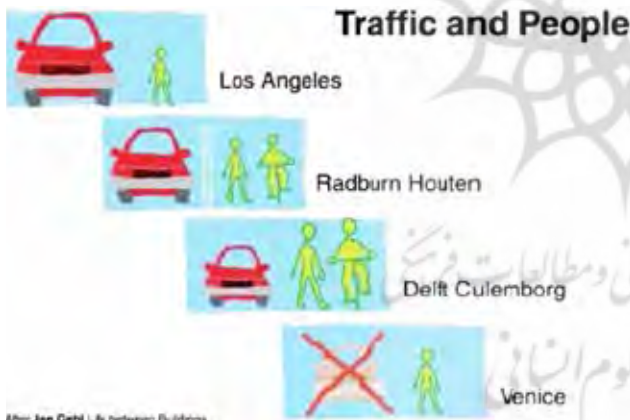
تصویر ۱: طبقه‌بندی یان گهل از روابط میان وسایل نقلیه و مردم.

اصل اساسی فضای مشترک این است که تمام کاربران جاده، به جای تفکیک، باید یکپارچه باهم ادغام شوند و هر کدام دارای حق مساوی از جاده باشند. طبق تصویر ۱،