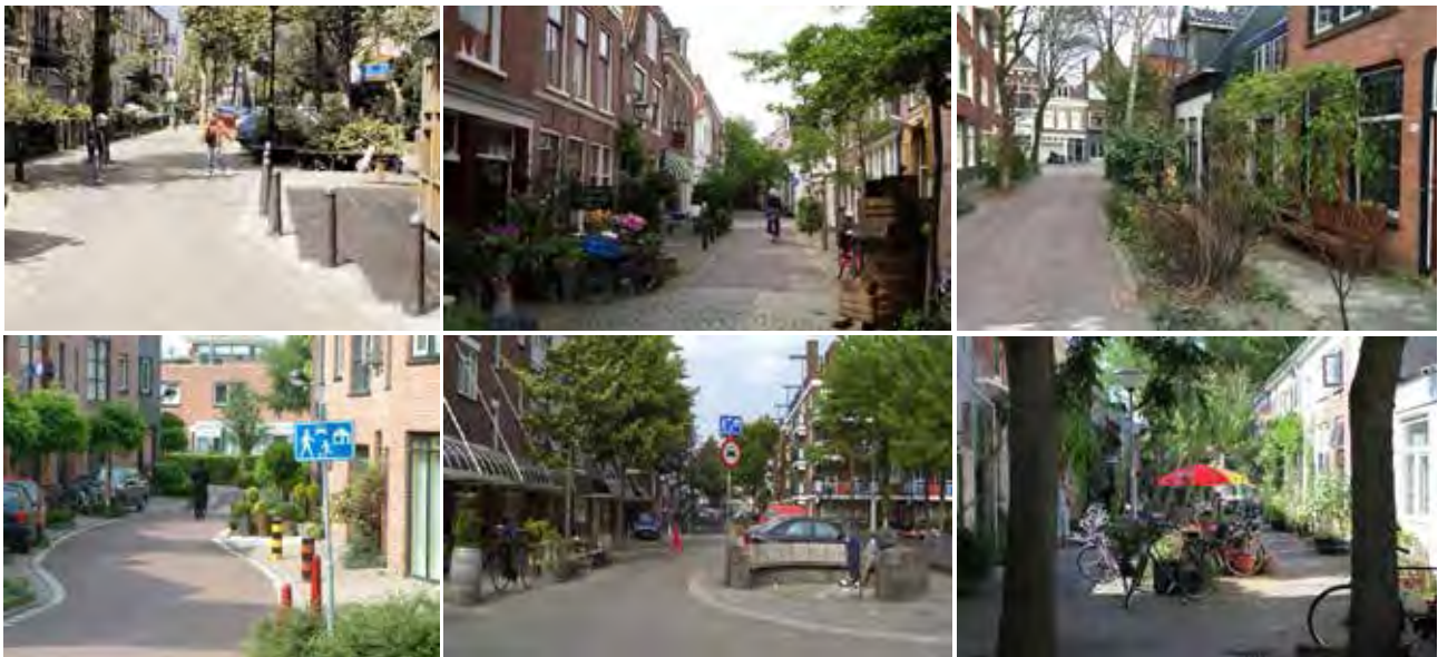
تصاویر ۲-۷: اولویت مسیر پیاده، دوچرخه و فضای بازی کودکان، مارپیچ کردن معابر و جانمایی مبلمان و فضای سبز محوطه در وونرف اولیه، دلف، هلند.

شبکه‌ای به فضای مشترک شهری می‌نگرد. به طوری که آن مودن (Anne Vernex Moudon) در کتاب «خیابان‌های عمومی برای استفاده عمومی» ۱۶ تئوری خیابان‌های دموکراتیک را بیان می‌کند؛ خیابان‌هایی که طرفدار اتومبیل‌مداری نیستند، اما فضایی را برای رسیدن به یک تعادل منصفانه با دیگر کاربران خیابان مانند پیاده‌ها و دوچرخه‌سوارها ایجاد و مانند خیابان‌های زیست‌پذیر بر ایمنی و آسایش تأکید می‌کنند. مودن، وونرف را به عنوان نمونه خیابان دموکراتیک موفق بیان می‌کند. همچنین دونالد ایلپارد (۱۹۸۰) در کتاب «خیابان‌های زیست‌پذیر»، مشخصات وونرف را این گونه به اختصار بیان کرده: «شما می‌توانید به راحتی در هر جایی در عرض خیابان وونرف قدم بزنید و کودکان می‌توانند در هر جایی آزادانه بازی کنند. رانندگان نباید مانع حرکت پیاده‌ها شوند و پیاده‌ها و کودکان در حال بازی نیز نباید مانع حرکت ماشین‌ها شوند. پارک کردن تنها در مکان‌هایی که حرف P بر روی زمین نوشته شده امکان‌پذیر است» (Moudon, 1991: 34) به نقل از فضائی و صدیق، ۱۳۹۲: ۳۳). نهایتاً الکساندر (Christopher Alexander) در کتاب «شهر درخت نیست» ۱۷ برای دستیابی به شکل صحیح شهر، الگوی ارتباطات درختی در شهرهای طبیعی و ارگانیک و همچنین الگوی نیمه‌شبکه در شهرهای مصنوعی و طراحی شده را با یکدیگر مقایسه کرده و معتقد است وونرف و آرام‌سازی ترافیک شهری در خیابان محلی نمونه‌ای از همین