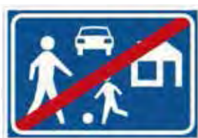
Exit from woonerf

تصویر ۱۰: علائم ورودی و خروجی وونرف در هلند: علایم انسان‌ها بزرگ‌تر از ماشین‌ها.