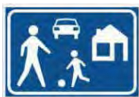
Entry to woonerf

لذا سیاست‌های به کار گرفته شده در وونرف دو هدف عمده را دنبال می‌کند: (۱) تأمین فرصت‌های مطلوب برای استفاده‌کنندگان از فضا با اولویت نیازهای عابران پیاده، دوچرخه‌سواران و سیستم حمل‌ونقل عمومی و (۲) احیای عملکردهای سنتی فضاهای شهری در محلات مسکونی. این اهداف در سه بعد مفهومی قابل دسته‌بندی هستند: (۱) فضای محلات باید امن بوده و امکان حضور بلاواسطه افراد را تضمین نماید؛ (۲) محلات بایستی امکان تحرک و جابجایی آزادانه افراد را در فضا فراهم آورد که در مورد کودکان و افراد سالخورده و کم‌توان جسمی حرکتی این مورد نمود مضاعفی می‌یابد و (۳) فضای محله باید جذابیت و مطلوبیت بصری و محیطی را برای افراد تأمین کند که در آنها رغبت حضور در فضای عمومی خیابان ایجاد شود که منجر به ارتقای حس تعلق محیطی و ایجاد حس مکان می‌شود (قاضی‌پور، ۱۳۹۱: ۳۱).