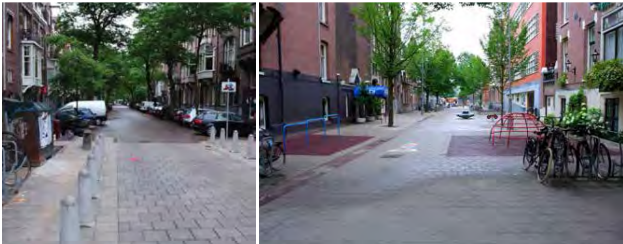
تصاویر ۸ و ۹: منظر شهری وونرف در آمستردام، هلند. مأخذ: Gillies, 2009:13 & Lusher, Seaman & Tsay, 2008: 14.

تا با احتیاط بیشتری در این محله‌های مسکونی رانندگی کنند (McBeath, 2009: 2).