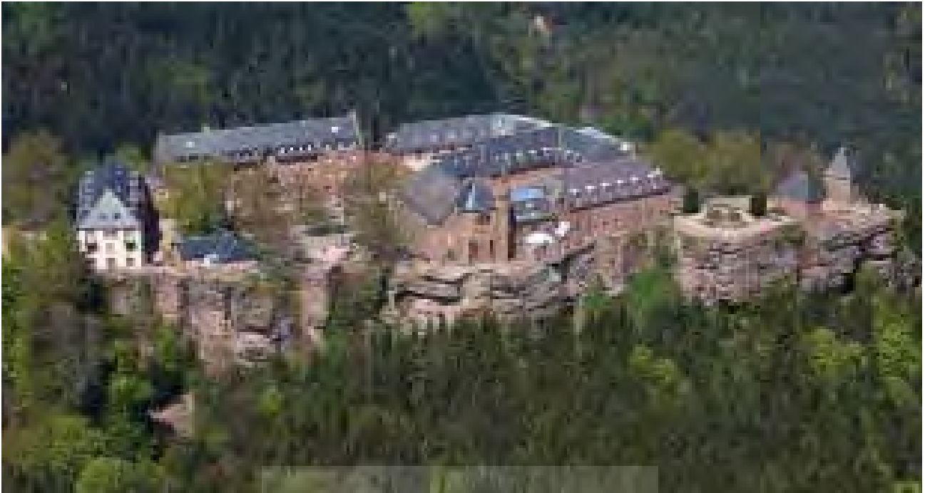
تصویر ۸: تپه سنت اودیل، ایالت آلزاس - فرانسه، مجموعه صومعه-کلیسا.