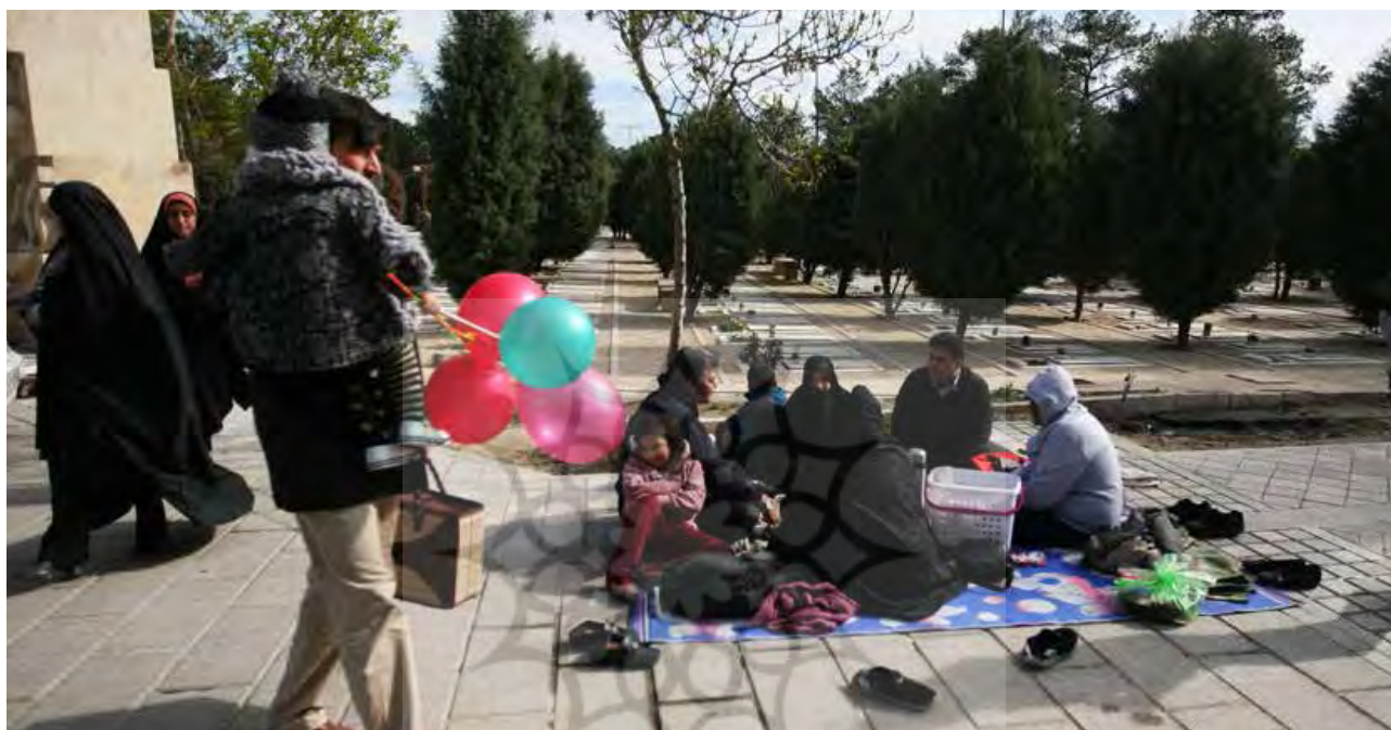
تصویر ۵: گورستان بهشت زهرا-تهران. افراد با گردهمایی و مراسم فاتحه‌خوانی به یاد عزیزان از دست رفته، سنت زیارت و تفریح را توأمان به‌جا می‌آورند، تهران.

سفرهایی که در ایام تعطیل نظیر نوروز، اعیاد مذهبی و ایام عزاداری سالار شهیدان به پابوس امامان معصوم و امامزادگان، انجام می‌شود نیز از همین جمله‌اند و به‌گونه‌ای گردش و استراحت را با حال‌وهوای روحانی و معنوی در هم می‌آمیزد (تصویر ۲). در گذشته در سفرهای زیارتی تا یک ماه به مشهد مقدس و گاه شش ماه را در کربلای معلّا و در جوار حرم امام حسین (ع) و حضرت علی (ع) ساکن می‌شدند. از نسل میان‌سال امروز شاید در