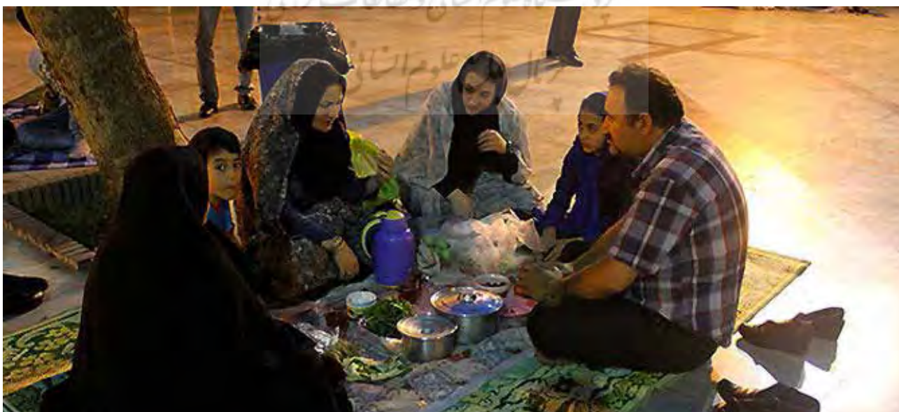
تصویر ۵: زیارت و گردش آئینی در امامزاده صالح، شمیران، تجریش، تهران.