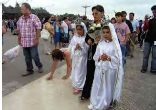
تصویر ۷: زیارتگاه فاطیما، لیسبون، پرتغال.