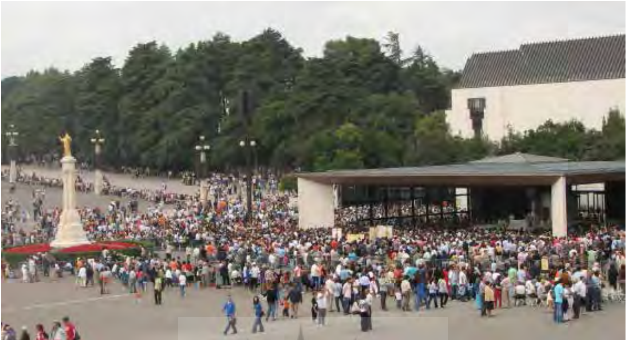
تصویر ۶: زیارتگاه فاطیما، لیسبون، پرتغال.

این روایت به تقدس مکان انجامیده است (تصویر ۱۲). در باور مسلمانان نیز حضرت فاطمه (س) این گونه روایات در ارتباط با اماکن مقدس در جوار کوه، چشمه یا درخت خاص وجود دارد که غالباً به باورهای پیش از اسلام بازمی‌گردد. در گذر زمان این مکان‌های زیارتی به گردشگاه‌های آیینی تبدیل شده‌اند و توانسته‌اند روح مکان و باورهای معتقدان را در قالبی نو حفاظت کنند.