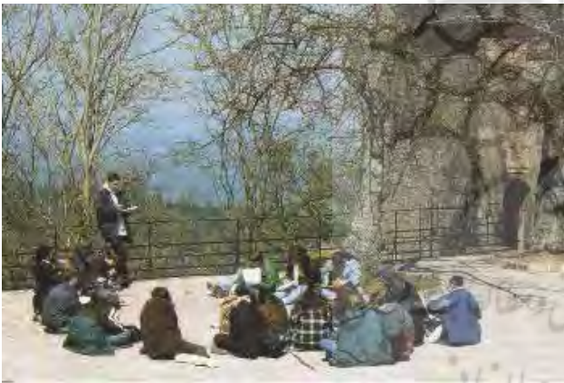
تصویر ۹: مکانی زیارتی - تفریحی برای استفاده تمام گروه‌های سنی.

پیوند با طبیعت، نیاز به معنویت و حال و هوای روحانی در زندگی مدرن و پرمخاطره امروز حفظ کرده‌اند. حمایت از این جریان اجتماعی و معرفتی، نگهداری از این میراث تاریخی - آئینی نیازمند شناخت صحیح و دور از خرافه و ساماندهی مکان‌های مرتبط با آنها است. برخی از این مکان‌ها در اثر توسعه‌های بی‌رویه و عدم شناخت متولیان از بین رفته است یا کمتر به آن رسیدگی می‌شود. ایجاد امکانات رفاهی و مدیریت برنامه‌های فرهنگی موجب رونق گردشگری آئینی می‌شود. آئین‌ها نمود بیرونی باورها و اعتقاداتی است که از فرهنگ جامعه برمی‌خیزد؛ مطالعه و شناخت آنها