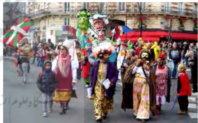
تصویر ۱۲: کارناوال پاریس.