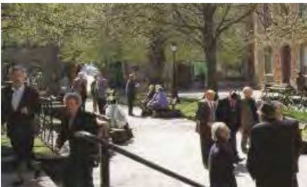
تصویر ۱۱: سایه قدیمی درختان به لیمو (درختان کهنسال که حکایت از قدمت محل و بناهای مقدس آن دارند).

پیوند با طبیعت، نیاز به معنویت و حال و هوای روحانی در زندگی مدرن و پرمخاطره امروز حفظ کرده‌اند. حمایت از این جریان اجتماعی و معرفتی، نگهداری از این میراث تاریخی - آئینی نیازمند شناخت صحیح و دور از خرافه و ساماندهی مکان‌های مرتبط با آنها است. برخی از این مکان‌ها در اثر توسعه‌های بی‌رویه و عدم شناخت متولیان از بین رفته است یا کمتر به آن رسیدگی می‌شود. ایجاد امکانات رفاهی و مدیریت برنامه‌های فرهنگی موجب رونق گردشگری آئینی می‌شود. آئین‌ها نمود بیرونی باورها و اعتقاداتی است که از فرهنگ جامعه برمی‌خیزد؛ مطالعه و شناخت آنها