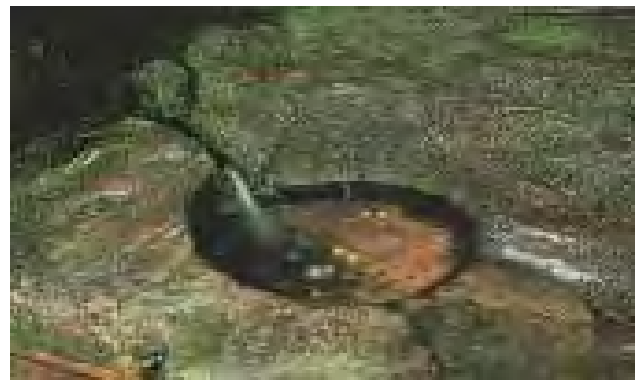
تصویر ۱۰: چشمه مقدس.