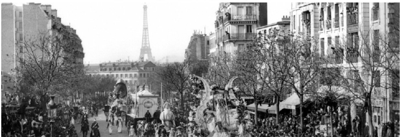
تصویر ۱۲: کارناوال پاریس در دهه ۵۰ میلادی.