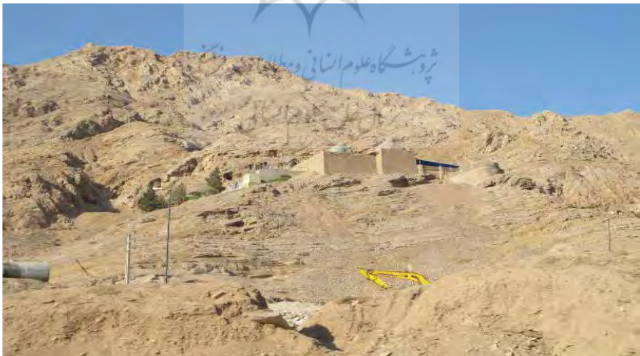
تصویر ۳: نمای کلی زیارت‌گاه بی‌شهربانو. عکس: ایو لوژنبول، ۱۳۹۳.

در طیف وسیعی از گردشگری آیینی، آداب و سنن وابسته به بستری هستند که این آیین‌ها در آن جاری می‌شوند