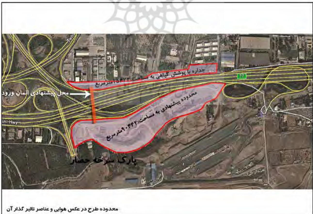
محدوده طرح در عکس هوایی و عناصر تاثیر گذار آن

مساحت ضلع جنوبی فضای در نظر گرفته شده برای استقرار دروازه ۹۰۴۴۲ و مساحت ضلع شمالی ۱۵۴۲۲ مترمربع است. لازم به ذکر است مساحت در نظر گرفته شده جهت ضلع (بال) شمالی محدوده، جهت استقرار پوشش گیاهی نرم، محوطه‌سازی و ساماندهی