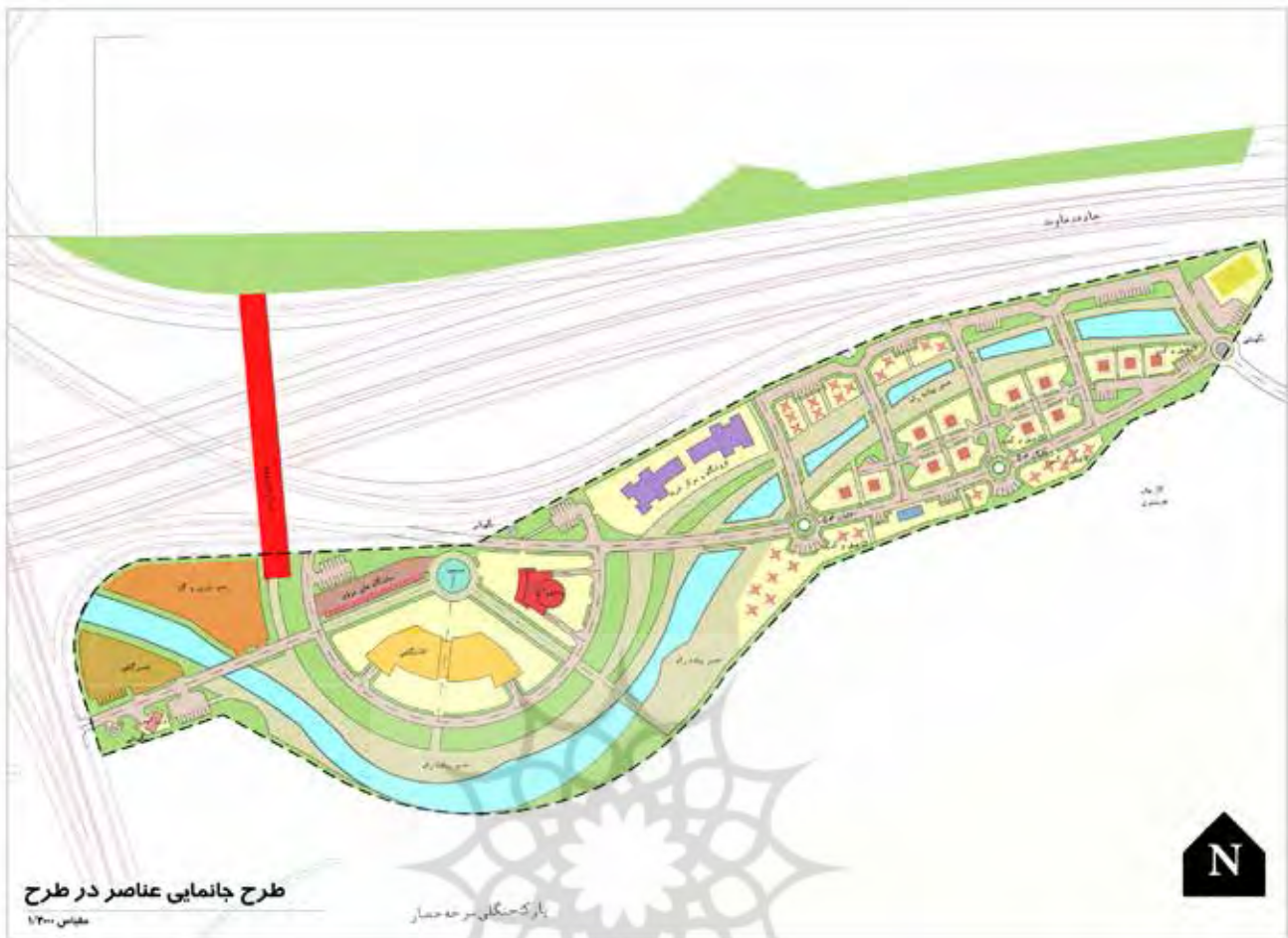
نقشه ۳: طرح جانمایی عناصر در طرح دروازه سرخه حصار.

پارک‌های حاشیه‌ای با هر عنوان و به هر وسیله، در جهت عدم اجازه ورود آنها به شهر و قالب شدن فضاهای شهری بر آنها، یکی از مسائل مهم و به‌روز در کلان‌شهرها و به ویژه «مادرشهر تهران» است. این پژوهش بر اساس مسائل بسیار مهم زیست‌محیطی شهر تهران که یکی از آنها اعتراض بر اقدامات جدید پایانه شرق و احاطه این مجموعه بر شرقی‌ترین قسمت‌های پارک سرخه حصار و همچنین بریده شدن درخت‌های حاشیه‌ای این پارک در لبه جنوبی بزرگراه شهید دوران، تنظیم شده است. شاید روش اتخاذ شده برای این پژوهش، راهکاری در جهت نگهداری از این کلان‌فضای حاشیه‌ای منطقه ۱۳ تهران است. با انجام این پژوهش «واژه‌های جدید» بر مبنای تحقیقات گسترده به وجود آمده است و آن عنوان (پارک- دروازه یا gate-park) است که تاکنون در هیچ منبع علمی یا پژوهشی به آن اشاره نشده است.