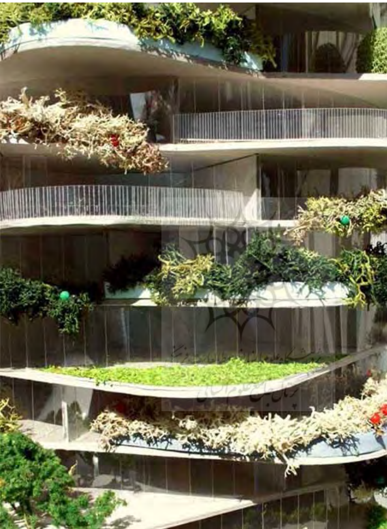
تصویر ۱: برج کاکتوس رتردام هلند بر اساس معماری بیونیک طراحی شده است.