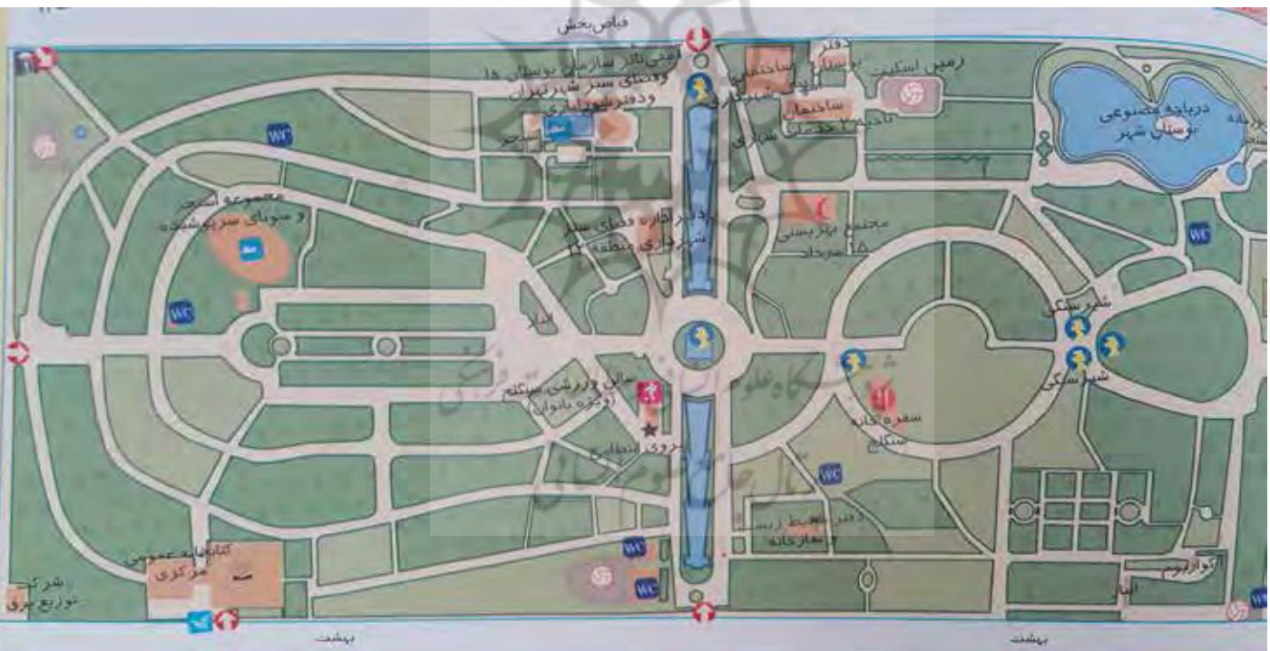
تصویر ۵: پلان پارک شهر.

«باغ ملی دارای بیشترین نزدیکی با شیوه‌های باغ‌سازی غربی اعم از پارک‌های عصر روشنگری و باغ‌سازی باروک پیشرفته است» (همان). طراحی پارک شهر تلفیقی از اصول به کار رفته در باغ‌سازی ایرانی و اروپایی است. ساختار فضایی پارک با استفاده از تداخل خطوط مستقیم و منحنی است و آب‌نمای طویل