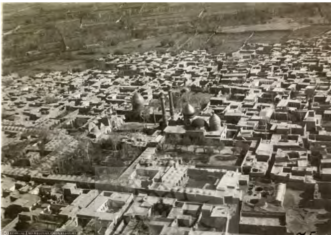
تصویر ۱: آرامگاه شاه عبدالعظیم و باغ‌های اطراف آن.

از یک سو شاهد اقدامات عمرانی و فعالیت‌هایی به منظور مدرن‌سازی کشور در شهرها، مانند تخریب محلات قدیمی و کشیدن خیابان‌های جدید و باغ ملی هستیم و از سوی دیگر، گسترش بروکراسی دولتی به عنوان وسیله‌ای برای تسلط و حاکمیت هرچه بیشتر حکومت مرکزی بر فعالیت‌های روزمره مردم شد (کاتوزیان، ۱۳۸۶).