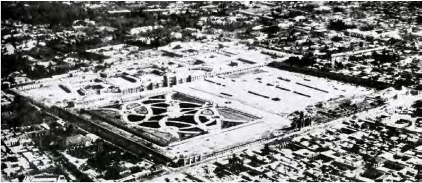
تصویر ۴: عکس هوایی باغ ملی تهران. مأخذ: حبیب، اعتصام و قدوسی فر، ۱۳۹۲