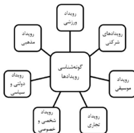
تصویر ۱. گونه‌شناسی رویدادها.

مطالعات انجام‌شده در حوزه پدیده اربعین را می‌توان در چند دسته تقسیم‌بندی کرد. دسته اول که حول محور روایت‌ها و تفسیرهای مرتبط با واقعه کربلا و عاشورا و اربعین هستند و تأکید آنها بیشتر بر جنبه‌های روایی دینی (شیرازی، ۱۳۹۳؛ ابادری، ۱۳۹۳؛ قاضی طباطبایی، ۱۳۶۸؛ گلی‌زواره، ۱۳۹۳) و سیاسی است. از جمله این تحقیقات که امروزه بحث سیاسی در آنها بسیار پررنگ‌تر است می‌توان به مطالعه محمدی و همکاران، که به تأسی از راه‌پیمایی اربعین به بازتعریف ژئوپلیتیک شیعه پرداخته است و ابعاد سیاسی این پدیده را تشریح نموده است، اشاره کرد (محمدی، سلیم‌نژاد و احمدی، ۱۳۹۶). دسته دوم به موضوعات اجتماعی و فرهنگی و درس‌هایی که باید از عاشورا و اربعین آموخت پرداخته‌اند (حسینی‌جلالی، ۱۳۹۳؛ زارع خورمیزی، ۱۳۹۳) که البته مطالعات اجتماعی‌ای از این دست می‌تواند بیشتر محل توجه قرار گیرد. دسته سوم از مطالعات به حوزه گردشگری مذهبی برمی‌گردد که جامعه ایرانی بنا بر ماهیت و وجود ظرفیت‌های فرهنگی مذهبی از این