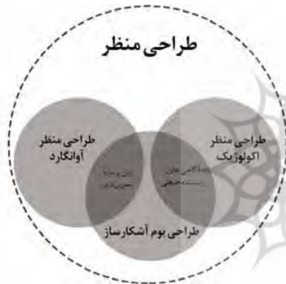
تصویر ۲. موقعیت طراحی بوم آشکارساز در میان رویکردهای طراحی منظر. مأخذ: نگارندگان.

طراحی بوم‌آشکارساز یکی از کانسپت‌های طراحی اکولوژیک در زمینه طراحی منظر است که تلاش دارد کیفیت‌های سایت را از طریق به کارگرفتن، اعیان‌سازی پدیده‌ها،