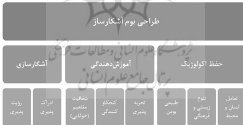
تصویر ۴. اهداف و اصول طراحی بوم‌آشکارساز.

از جمله موضوعاتی که رویکرد بوم‌آشکارساز به آن می‌پردازد نقش آب در شهر است. در این راستا رویکرد بوم‌آشکارسازی در پی عیان کردن آب‌های پنهانی است که به واسطه توسعه‌های کالبدی و شبکه‌های انتقال آب و فاضلاب از دید مردم پنهان مانده‌اند. در واقع با آشکار شدن ساختارهای آبی چون مسیل‌ها و ایجاد فضاهای شهری پویا، اهمیت و نقش