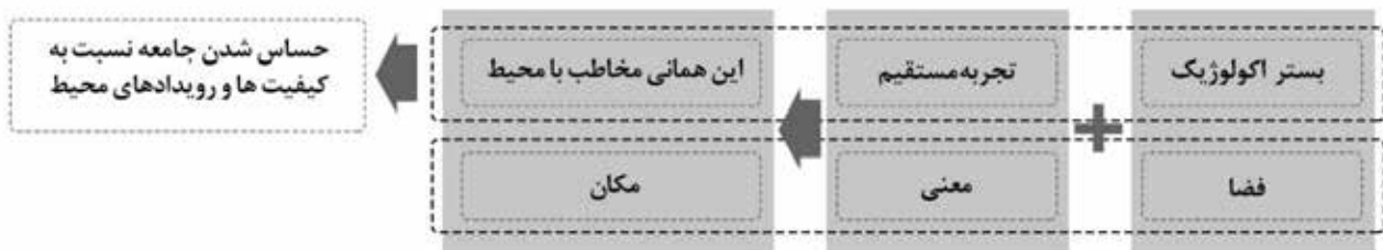
تصویر ۳. بوم‌آشکارسازی و فرایند ادراک.

اریسوی ۱۲ در کتاب "پیشرفت‌هایی در طراحی منظر" ۱۳ معتقد است، تفسیر از فرایندهای اکولوژیکی، به توانایی طرح برای آشکارکردن فرایندهای اکولوژیکی در عمل باز می‌گردد. فرایند آشکارسازی تنها زمانی می‌تواند موفق باشد که ساخته‌های محیط نمایان، قابل رؤیت، خوانا و دارای توانایی برای بالا بردن کنجکاوی در مخاطبان باشد تا پیچیدگی‌های منظر را قابل درک و روشن سازد. بر همین اساس وی اصول عام طراحی بوم‌آشکارساز را به صورت زیر توصیف می‌کند: رؤیت‌پذیری ۱۴ ، پایداری ۱۵ ، طبیعی بودن ۱۶ ، ادراک‌پذیری ۱۷ .