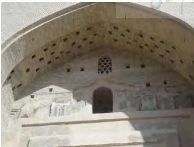
تصویر ۴. بقایای اندود گچ در زیر پیش‌تاق ورودی هارونیه. عکس: حسین کوهستانی، ۱۳۹۶.

گنبد دو پوش بنای هارونیه نیز از جمله مواردی است که به علت ارتفاع زیاد و دید مناسب می‌توانست مکان مناسبی برای