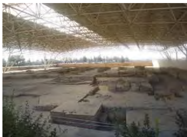
تصویر ۲. مسجد مکشوفه در مجاورت جبهه جنوبی بنای هارونیه. عکس: حسین کوهستانی، ۱۳۹۶.

تعیین عملکرد، هویت و دوره ساخت اثر است، روش پژوهش منطبق بر روش‌های توصیفی-تحلیلی و روش تحلیل تاریخی، به صورت مطالعه اسنادی و کتابخانه‌ای مبتنی بر بررسی منابع مکتوب، به ویژه متون تاریخی و جغرافیایی و منابع غیر مکتوب و مطالعات میدانی است.