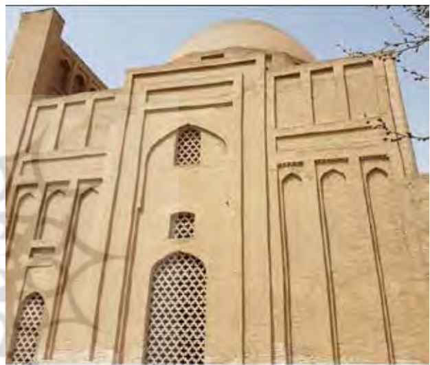
تصویر ۶. تاق‌نماها و نغول‌های ضلع شرقی.

منفرد دیده می‌شود اما بررسی و تحلیل معماری بنا نشانگر آن است که این قسمت از ابتدا به عنوان بخشی از یک مجموعه طراحی شده است. وجود سه اتاق در بخش شمالی بنا، محرابی در نمای بیرونی شمال ساختمان، وجود چهار ورودی در چهار طرف بنا و همچنین ناتمام بودن معماری ساختمان بیانگر آن است که ساختمان فعلی تنها قسمتی از مجموعه‌ای بوده که امکان ساخت آن فراهم شده است. ضمن آن که کاوش‌های باستان‌شناسی نیز در دهه هشتاد شمسی موفق به کشف بقایای از مسجد بزرگی شده است که احتمالاً در دوره‌هایی قسمتی از مجموعه معماری هارونیه محسوب می‌شده است (تصویر ۷).