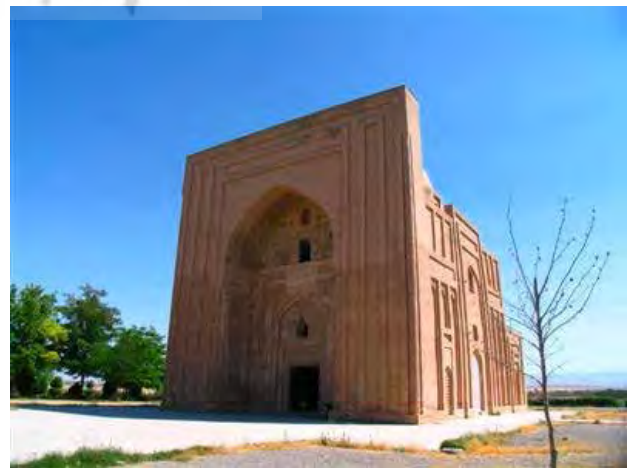
تصویر ۱. هارونیه، نمای جنوبی و شرقی. عکس: حسین کوهستانی، ۱۳۹۶.

در دهه‌های اخیر، تحقیقاتی به صورت مکتوب در مورد معماری بنای هارونیه و کارکرد و قدمت آن توسط محققان ایرانی و غیرایرانی انجام شده است (تصویر ۱، نقشه ۱). در این میان محققانی نظیر «ویلیبر» (۱۳۶۵: ۱۵۸-۱۵۷) و «پوپ» (Pop, 1938: 1702, 1704) به تشریح و تحلیل کامل‌تری از بنا پرداخته‌اند. از میان محققان ایرانی نیز در دهه‌های اخیر افرادی همچون «محمد محیط طباطبایی» (۱۳۵۳: ۱۰)، «مهدی سیدی» (۱۳۳۹: ۲۶)، «رجبعلی لباف خانیکی» (۱۳۷۸: ۶۵) و سید محسن حسینی (۱۳۷۴: ۴۹) هرکدام سعی کرده‌اند به بررسی و تجزیه و تحلیل ابهامات بنا بپردازند. در این میان نتایج قابل توجهی نیز به دست آمده است. همچنین در راستای شناخت بنای هارونیه، در سال ۱۳۵۴ ه. ش. کاوش‌هایی در داخل بنا انجام گرفته است (آرشیو اداره کل میراث خراسان رضوی). بنای هارونیه هر چند امروزه به صورت یک بنای منفرد تقریباً در وسط شهر تابران توس قرار گرفته است، اما با توجه به شماری از نوشته‌های سیاحان دوره قاجار همچون فریزر (Fraser, 1825: 517) خانیکف (۱۳۷۵: ۱۲۱) و اعتمادالسلطنه (۱۳۶۴: ۱۸۱) می‌توان استنباط کرد تا دوره قاجاریه در پیرامون این بنا آثار معماری دیگری از جمله یک منار و یا قلعه چهاربرجی وجود داشته است. نتایج کاوش‌های باستان‌شناسی دهه‌های اخیر (موسوی، ۱۳۷۰؛ لباف خانیکی و بختیاری شهری، ۱۳۷۵ و طغرای، ۱۳۸۲) نیز تأییدی به این نکته است. از توصیفات بازدیدکنندگانی به طور کلی از