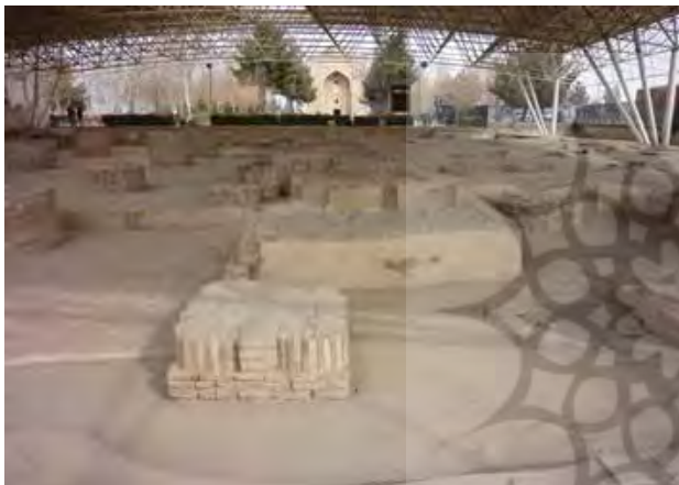
تصویر ۷. بقایای مسجد مجاور بنای هارونیه.