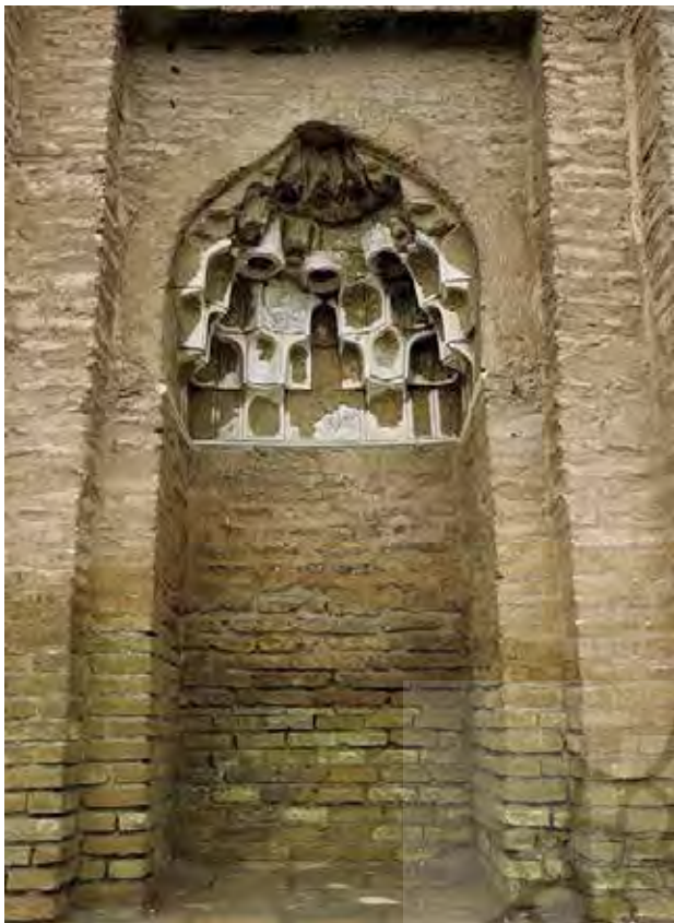
تصویر ۸. محراب بیرونی جبهه شمالی بنا. عکس: حسین کوهستانی، ۱۳۹۶.

هیچ‌گاه امکان تکمیل این بنای عظیم فراهم نشد. در همین راستا تفکرات مذهبی حکومت غالب یعنی آل کرت موجب تخریب نشانه‌های مذهبی یا تاریخی این بنا شد، این امر موجب شد که چپستی بنای مذکور در دوره‌های بعد در هاله‌ای از ابهام و گمنامی فرورفته و پرسش‌های بی‌پاسخ فراوانی در مورد کارکرد و قدمت آن پدید آید. چندی بعد، سقوط دولت آل کرت توسط میران شاه (در سال ۷۹۱ ه. ق.) و قتل و غارت گسترده مردم شهر توس توسط او باعث شد تا انتقال هویت شخص مدفون در بنا از طریق روایات شفاهی مردم شهر ناممکن شده و قدمت یا کارکرد بنا نیز به فراموشی سپرده شود. عوامل دیگری نیز در هرچه بیشتر فراموش شدن کارکرد و قدمت واقعی بنای هارونیه مؤثر افتاد که از جمله آنها می‌توان به انتقال آب شهر توس به مشهد در دو دوره تیموری و صفوی اشاره کرد که موجب تسریع روند تخریب و ویرانی شهر شد. اهمیت یافتن شهر مشهد، به ویژه در دوره صفویه، تحت تأثیر حرم امام رضا(ع) در نتیجه سیاست مذهبی این دولت در مهم شمردن هرچه بیشتر مقابر امامان و امامزادگان و کم‌توجهی به مقابر شیوخ و عرفا باعث شد بار دیگر شهر توس و تک بنای ماندگار آن به فراموشی سپرده شود. اندک مردم باقی‌مانده