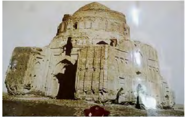
تصویر ۵. هارونیه، نمای شرقی و جنوبی.

سربداران در آغاز حکومت، با توسعه کارهای عمرانی شهر توس سعی در جلب حمایت بیشتر مردم داشتند. عمل توسعه و عمران با ترمیم خرابی‌های حکومت جانی قربانی‌ها آغاز شد (همان). مسلماً بازتاب مثبت این فعالیت‌ها می‌توانست به عنوان حمایت‌کننده و پشتیبان ایدئولوژیک اهداف درازمدت سیاسی-مذهبی سربداران مورد استفاده قرار گیرد. همچنین با توجه به نقش عمده و مهم توس در کشمکش‌ها و رقابت‌های قدرت طلبانه حکومت‌های سده ۸ ه.ق، احتمالاً سربداران پس از مرگ دراویش و شیوخ مورد احترام شهر، ساخت مقبره‌ای