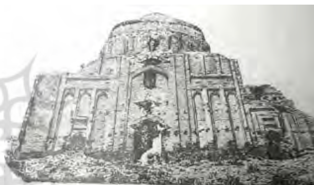
تصویر ۳- نمای شرقی هارونیه در دوره قاجاریه.

بنای "هارونیه" از نوع بناهای چهارضلعی گنبددار بوده، نمای بیرونی آن از دو بخش بدنه و گنبد تشکیل شده و گنبد اصلی بر روی یک فضای مربع شکل قرار گرفته است. بنای هارونیه، به طور کلی از سه قسمت پیش‌تاق، گنبدخانه و سه اتاق ضلع شمالی تشکیل شده است. بدین صورت که بنا دارای پیش‌تاقی به بلندی حدود ۲۱ متر در قسمت جنوبی است و در حال حاضر امکان ورود و خروج به فضای داخلی بنا از طریق ورودی این پیش‌تاق صورت می‌گیرد. فضای گنبدخانه در داخل، مربع شکل بوده و چهار شاه‌نشین با تاق مقرنس‌کاری شده در چهارسوی آن دیده می‌شود. همچنین چهار پلکان مارپیچی در چهارسوی فضای گنبدخانه وجود دارد که فضای قسمت پایینی گنبدخانه را به دهلیز و راهروی طبقه دوم و همچنین پشت‌بام گنبدخانه پیوند می‌دهد (نقشه ۱). در فضای داخلی گنبدخانه، در منطقه انتقالی با ایجاد گوشه‌سازی، زمینه تبدیل نقشه مربع بنا به هشت و سپس به شانزده ضلعی فضای ایجاد گنبد فراهم شده است. گنبد بنا از نوع گنبد‌های دو پوش گسسته به ارتفاع حدود ۲۵ متر است. در قسمت درونی بنا سه اتاق با ابعاد نسبتاً کوچک در ضلع شمالی وجود داشته و ارتباط آنها از طریق راهروهایی با یکدیگر و همچنین با فضای گنبدخانه صورت می‌پذیرد (تصویر ۱).