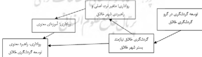
تصویر ۱. مدل مفهومی پژوهش

خلاقیت با توسعه فرآورده‌ها و تجارب گردشگری، احیای مجدد فرآورده‌های موجود، افزودن بر ارزش مادی دارایی‌های فرهنگی و خلاقانه، ایجاد فرآورده‌های جنبی