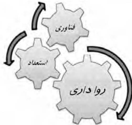
تصویر ۳. متغیرهای شهر خلاق. ماخذ: Teresa, 2010.

در سطح بین‌المللی سازمان‌هایی نظیر سازمان آموزشی، علمی و فرهنگی سازمان ملل متحد ۸ با طرح شبکه جهانی شهرهای خلاق، سازمان همکاری و توسعه اقتصادی ۹ و کمسیون اروپا ۱۰ نیز از این ایده در سیاستگذاری‌های خود استفاده کردند. البته زمینه پرداختن به ایده شهر خلاق در یونسکو را باید در سال ۲۰۰۱ و بیانیه جهانی تنوع فرهنگی، جستجو کرد که به دنبال نفی استانداردسازی فرهنگ تحت شرایط جهانی شدن بود (Sasaki, 2010). شبکه شهرهای خلاق یونسکو نشان دهنده پتانسیل بسیار بالای فرهنگ برای تقویت توسعه پایدار است. شهرها با پیوستن به این شبکه متعهد می‌شوند که با نگرش تقویت خلاقیت و صنایع فرهنگی، مشارکت را در زندگی فرهنگی ارتقا داده و فرهنگ را در طرح‌ها و استراتژی‌های توسعه اقتصادی و اجتماعی بگنجانند. گفتنی است دستور کار توسعه پایدار برای سال ۲۰۳۰ که سپتامبر سال ۲۰۱۵ به تصویب رسید، بر نقش فرهنگ و خلاقیت به عنوان اهرم‌های کلیدی برای توسعه پایدار شهری تأکید می‌کند. شاید اصلی‌ترین مزیت حضور در این شبکه را بتوان در افزایش آگاهی جهانی از ویژگی‌های منحصر به فرد هر یک از این شهرها دانست که در نهایت می‌تواند به افزایش سرمایه‌گذاری، استفاده بهینه از سرمایه‌های انسانی، رونق گردشگری داخلی و بین‌المللی و در نهایت رونق اقتصادی و فرهنگی این شهرها بیانجامد.