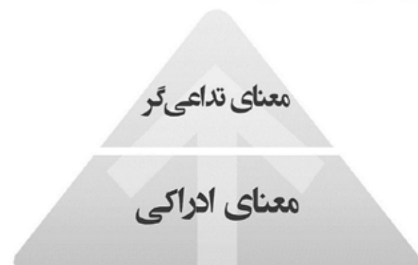
تصویر ۱. سطوح معانی محیطی در فضاهای معماری و شهری، مأخذ: نگارندگان بر اساس راپوپورت (۱۹۹۹).

محیط انسان‌ساخت شامل دو دسته معانی است : معانی