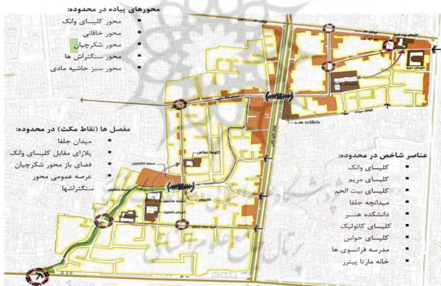
شکل شماره ۳: استخوان بندی محله جلفا

عناصر هویت بخش باید دارای ویژگی های پیوستگی و یکنواختی باشد و نقاط مشترکی بین گروه ها و نسل های مختلف ایجاد کند. در محله جلفا وجود میدانچه های محله ای، همچنین گذرهای بین آن به نوعی نشان دهنده اصل پیوستگی در فضا و وجود فضاهای متباین در طول مسیر شده است. (نوفل، سیدعلیرضا، کلبادی، پارین و محمدرضا پورجعفر، ۱۳۸۸).