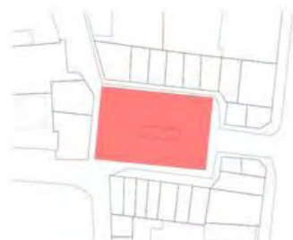
شکل شماره ۴: میدانچه جلفا

میدان جلفا از سمت شمال به خیابان نظر، از شرق به خیابان توحید، از غرب به کوچه ی کلیسا وانک و از جنوب به کوچه های خیابان مهرداد (شهید قندی) منتهی می شود.