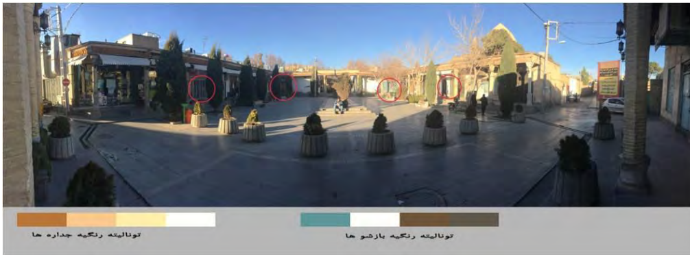
شکل شماره ۵: تحلیل عوامل کیفیت ساز محیط در میدان جلفا