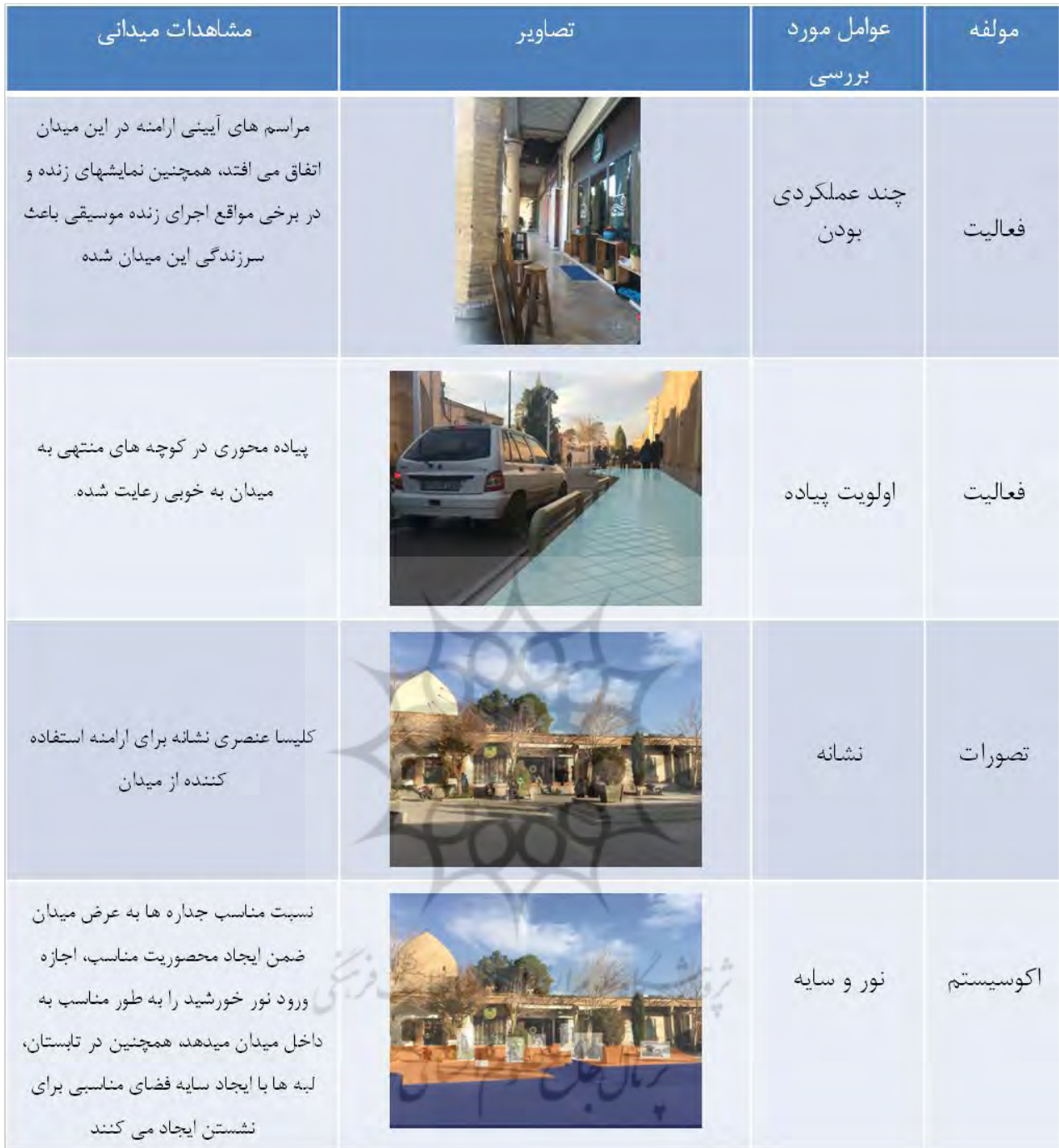
جدول شماره ۲: تحلیل عوامل کیفیت ساز محیط در میدان جلفا