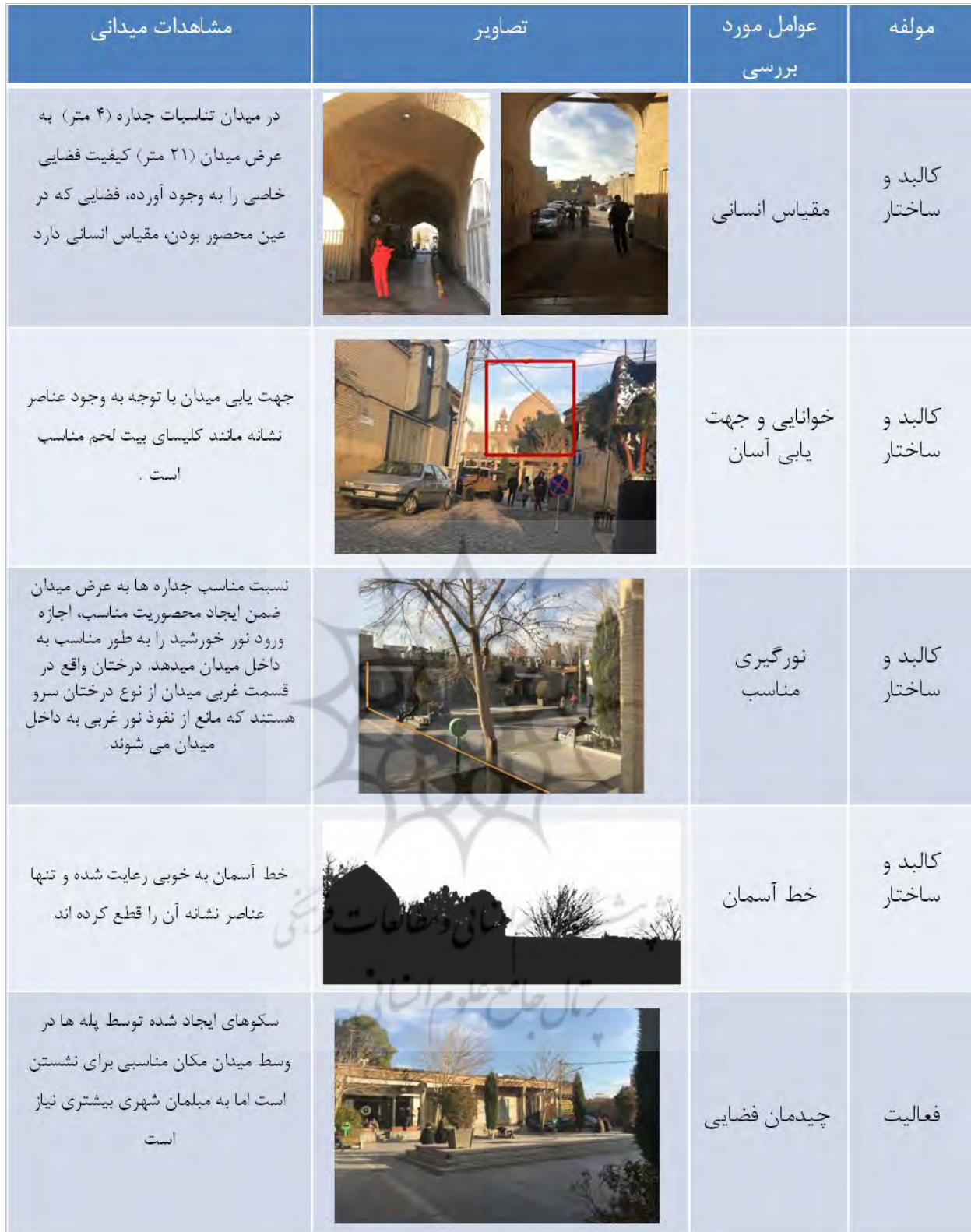
جدول شماره ۱: تحلیل عوامل کیفیت ساز محیط در میدان جلفا