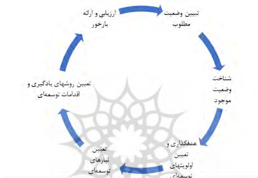
شکل ۲: الگوی اولیه برنامه توسعه فردی

موضوع و ایجاد تصویر روشنی در ذهن محقق، نسبت به بررسی ادبیات مرتبط با موضوع و مرور نظری مباحث مربوطه اقدام گردید و تلاش شد تا پژوهش در بستری قرار گیرد که ارتباط آن با پژوهش‌های پیشین نشان داده شده و با نتایج مختلف پژوهش‌های پیشین پیوند یابد. در این راستا، ضمن تعریف دقیق و تحدید مسئله و با استفاده از مرور گسترده ادبیات و مطالعه مستندات و انجام مطالعات تطبیقی، الگوی اولیه برنامه توسعه فردی ارائه گردید.