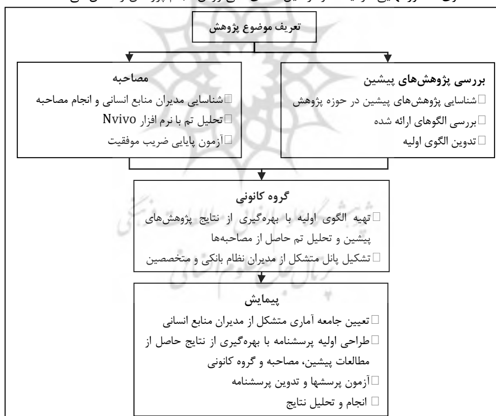
شکل ۱: فرایند اجرای پژوهش منبع: (یافته‌های نگارندگان)

یا استفاده از روش‌ها به صورت موازی یا همزمان (۲۳) (نیومن، ۱۳۹۵)؛ در این پژوهش شیوه متوالی بکار گرفته شده است. به منظور تحقق اهداف پژوهش، با مطالعه سوابق پژوهش‌های پیشین، شناختی از وضع موجود در این زمینه حاصل و مدل‌ها و چارچوب‌های موجود بررسی گردیده است. با عنایت به وجود الگوهایی در خصوص شایستگی‌های مدیران منابع انسانی، به منظور دستیابی به الگویی جامع، از روش بررسی مستندات استفاده شد. در ادامه از طریق مصاحبه عمیق با مدیران منابع انسانی نظام بانکی ضمن در نظر داشتن بافت و زمینه پژوهش، نسبت به اخذ نظرات آنها در ارتباط با شایستگی‌های مدیران منابع انسانی اقدام، و با بکارگیری روش تحلیل تم، الگوی شایستگی اولیه تدوین شد. در ادامه گروه کانونی از متخصصین منابع انسانی در صنعت بانکداری و اساتید صاحب‌نظر در حوزه منابع انسانی برای همکاری در طراحی و اعتباربخشی به چارچوب الگوی شایستگی تشکیل گردید و در این خصوص هم‌اندیشی و توافق صورت پذیرفت. در نهایت به منظور نهایی‌سازی مولفه‌های شایستگی و اولویت‌بندی آنها، پرسشنامه‌ای تدوین و در اختیار کلیه مدیران منابع انسانی بانک‌های کشور قرار داده شد و در خاتمه الگوی مذکور نهایی گردید. نمودار ذیل شمای کلی روش انجام پژوهش را نشان می‌دهد.