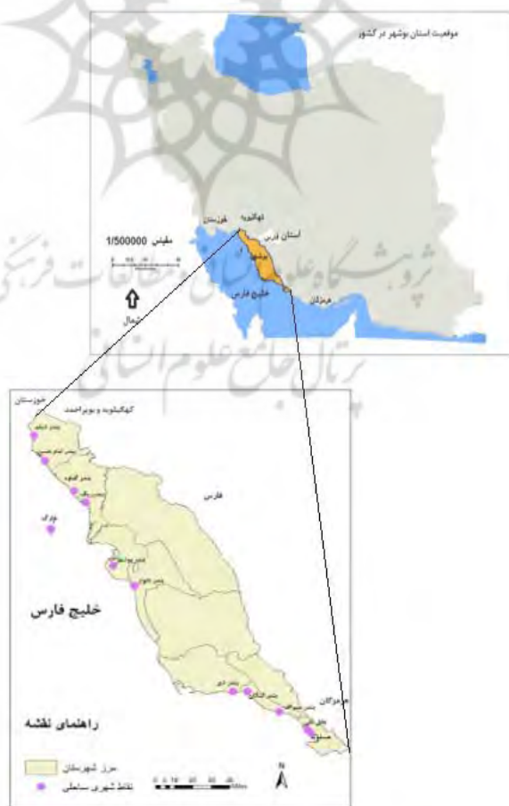
شکل شماره ۳. موقعیت شهرهای ساحلی استان بوشهر

استان بوشهر با ۲۳۱۹۷ کیلومتر مربع وسعت (هفدهمین استان کشور از نظر مساحت) در جنوب غرب ایران، واقع شده است. این استان از سمت شمال به استان‌های خوزستان و قسمتی از کهگیلویه و بویر احمد، از جنوب به خلیج فارس و قسمتی از استان هرمزگان، از شرق به استان فارس و از مغرب به خلیج فارس محدود شده و دارای مرز آبی به طول ۶۲۵ و با احتساب خورها ۷۰۰ کیلومتر با خلیج فارس می‌باشد. محدوده مورد مطالعه این تحقیق، شهرهای ساحلی استان بوشهر از بندر دیلم در شمال تا بندر عسلویه در جنوب شامل ۱۳ شهر با جمعیتی ۴۴۸۱۰۶ نفر می‌باشد. (شکل ۳) شهرهای ساحلی بر حسب میزان و نحوه عرضه خدمات و منابع گردشگری، به طور متفاوت از بازارهای گردشگری متأثر شده‌اند، وجود آثار تاریخی متعدد، چشم‌اندازهای متنوع از سواحل باتالاقی زاگرس جنوبی و خلیج فارس، جنگل‌های مانگرو، تالاب‌ها، مرغزارهای دریایی و آب سنگ‌های مرجانی، صنایع دستی، صنایع عظیمی چون نفت، گاز، پتروشیمی و نیروگاه هسته‌ای، این منطقه را به مقصد گردشگران داخلی و خارجی تبدیل نموده است. جاذبه‌های فرهنگی، تجاری و ... از دیگر ظرفیت‌های جذب گردشگر استان می‌باشد. این استان از لحاظ اقلیمی، (شرایط نسبتاً مساعد آب و هوایی در شش ماه) باعث سیل گردشگران داخلی به این استان می‌شود.