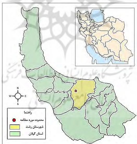
شکل ۲. نقشه موقعیت محدوده مورد مطالعه در تقسیمات سیاسی کشور و استان

محدوده مورد مطالعه، شهر رشت از توابع استان گیلان در شمال ایران است که در ۴۹ درجه و ۳۶ دقیقه طول شرقی، و ۳۷ درجه و ۱۶ دقیقه عرض شمالی قرار دارد. براساس سرشماری رسمی سال ۱۳۹۰، جمعیت این شهر ۹۵۱ هزار و ۶۳۹ نفر، و تعداد خانوارهای آن ۲۰۴ هزار و ۵۴ بوده است. محدوده استحفاظی آن نیز براساس طرح جامع این شهر در سال ۱۳۸۶، ۱۶ هزار و ۱۸۸ هکتار است (مهندسان مشاور طرح کاوش، ۱۳۸۶: ۹). در شکل ۲ محدوده مورد مطالعه تقسیمات کشوری نشان داده می‌شود.