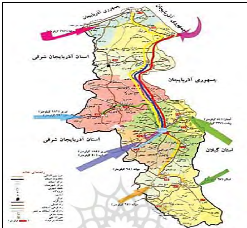
شکل شماره ۱: نقشه مسیرهای عمده گردشگری به استان اردبیل