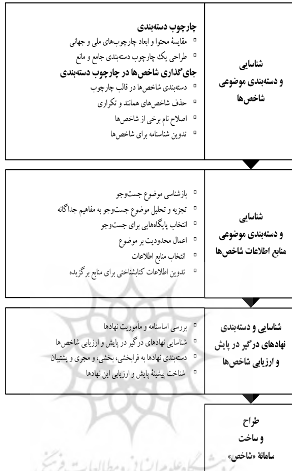
شکل ۱. روش انجام پژوهش