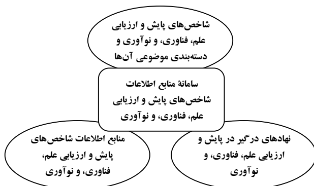
شکل ۲. چارچوب مفهومی سامانه منابع اطلاعات شاخص‌های پایش و ارزیابی علم، فناوری، و نوآوری