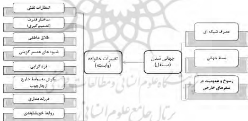
نمودار ۱: الگوی نظری پژوهش

به ۴۰۰ نفر افزایش یافت. روش نمونه‌گیری نیز خوشه‌ای چند مرحله‌ای ۱ متناسب با حجم است که به نمونه‌گیری احتمالی متناسب با حجم pps ۲ معروف است. در این شیوه احتمال انتخاب هر بلوک به تعداد خانوارهای آن بستگی دارد. چارچوب جامعه آماری در واقع بلوکهای ساختمانی شهر زنجان هستند که از طریق روش نمونه‌گیری به روش نمونه‌گیری احتمالی متناسب با حجم pps بلوکهای هر منطقه (مناطق شهرداری ۶ گانه) ۴۰ بلوک انتخاب شده است و از هر بلوک پنج خانوار با روش نمونه‌گیری تصادفی سامانمند انتخاب شد تا حجم نمونه پیش‌بینی شده را پوشش دهد. بنابراین در این پژوهش، پنج همگروه ازدواج که در پنج سال، ده سال، ۱۵ سال، ۲۰ و ۲۵ سال زندگی مشترک خود هستند به نسبت مساوی از هر یک از همگروه‌های ازدواج انتخاب شد و مصاحبه (تکمیل پرسشنامه) صورت گرفت. در تحقیق برای تعیین اعتبار از اعتبار صوری و تحلیل عامل تأییدی با استفاده از نرم‌افزار AMOS و برای سنجش پایایی ابزار تحقیق از آزمون آلفای کرونباخ استفاده شد که ضریب آلفای کل (۰/۸۳) به دست آمد. هم‌چنین برای تجزیه و تحلیل داده‌ها از نرم‌افزار spss استفاده شد.