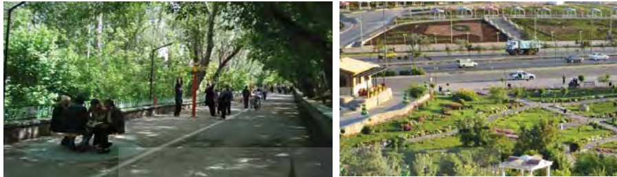
شکل ۴- تصویری از فضای خانوادگی و طبیعی در جنوب شرقی و غربی پارک ائل گلی، بخش ۳ از نقشه پارک (سمت راست)؛ تصویری از جاده سلامت پارک ائل گلی، بخش ۴ از نقشه پارک (سمت چپ)، مأخذ:

مواد غذایی، دسترسی به لونا پارک (شهربازی) و پارکینگ‌ها، فضای ورزشی (جاده سلامت) در شمال استخر و محدوده دسترسی بین مکان‌های ۲ و ۳ را شامل می‌شود (شکل ۴، تصویر سمت چپ).