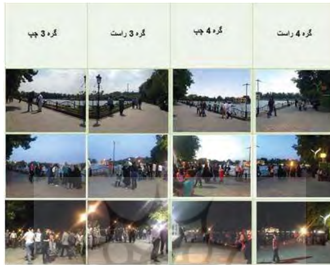
شکل ۶- مقایسه میزان ازدحام در ساعات شب و روز در گره‌های ۳ و ۴؛ مأخذ: نگارندگان

با توجه به مشاهدات و بررسی میدانی محقق در پارک ائل گلی، میزان روشنایی دور استخر بیشتر از سایر مکان‌ها است، میزان نور و روشنایی (آلودگی نور) که یکی از مؤلفه‌های عامل آسایش بصری و محیطی مؤثر بر احساس امنیت زنان است، اغلب، اوقات فراغت زنان در اطراف استخر رخ می‌دهد و این خود عامل تقویت‌کننده روانی برای زنان در پارک است. مطابق نظرات زنان شرکت‌کننده در مصاحبه، امنیت در این قسمت از پارک بیشتر از سایر مکان‌ها است.