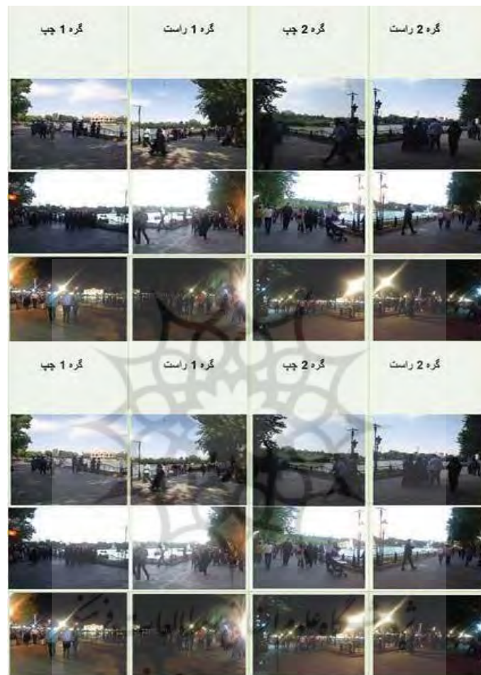
شکل ۵- مقایسه میزان ازدحام در ساعات شب و روز در گره‌های ۱ و ۲؛ مأخذ: نگارندگان