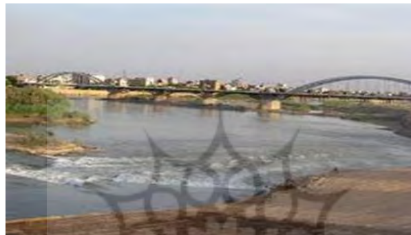
رودخانه کارون