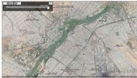
نقشه رودخانه کارون در اهواز

آن عبور کرده و از سمت جنوب شهرستان به سمت خرمشهر جریان می یابد. در شرق شهر خرمشهر به دو شاخه تقسیم می شود. شاخه غربی به نام بهمنشیر به جنوب غربی جریان یافته و از طریق خور موسی به خلیج فارس راه می یابد و شاخه شرقی از جنوب خرمشهر گذشته و به اروندرود می ریزد.