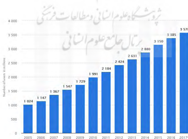
نمودار ۱. تعداد کاربران اینترنت در جهان بر اساس میزان جمعیت

همان‌طور که از آمار و ارقام برمی‌آید و در نمودار ۱ نیز بسیار مشهود است روند افزایش استفاده از اینترنت در دنیا بسیار سریع بوده است.