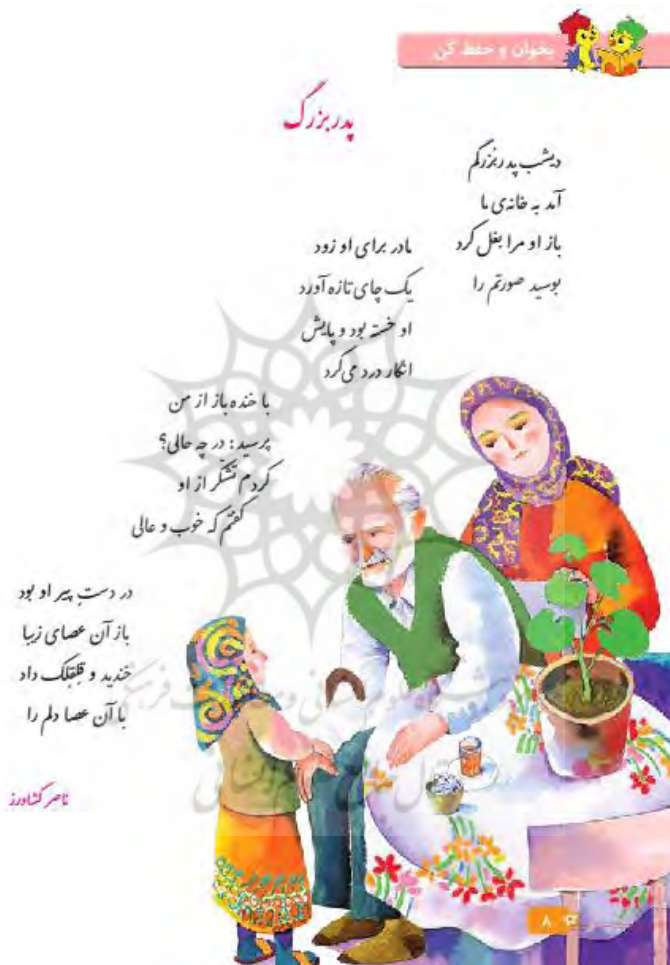
تصویر (۲). شعر «پدر بزرگ»، سال سوم ابتدایی

بررسی استعاره‌های مفهومی به کاررفته در شعر بالا نشان می‌دهد که استعاره‌های به‌کاررفته در دو سطح کلام و غیر کلام، در یک راستا و یک جهت بوده و با یکدیگر تطابق کامل دارند. بدین ترتیب، تصویرگر به درستی مفاهیم استعاری به‌کاررفته در شعر را در تصویر پیاده کرده است.