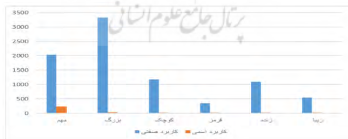
نمودار شماره (۲). بسامد اسم‌های <ویژگی، ارجاع> در پیکره بیجن‌خان

چنانکه جدول فوق نشان می‌دهد، اسم‌های <ویژگی، ارجاع> در اکثر موارد فاقد معیارها و زیرمعیارهای اسامی سرنمون هستند. با این حال، این اسامی به یک اندازه غیرسرنمون نیستند، بلکه در یک پیوستار قرار دارند. نمودار زیر نشان‌دهنده میزان بسامد این کلمات در دو نقش اسمی و صفتی در پیکره بیجن‌خان است: