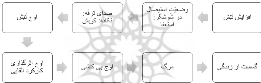
شکل ۳: نمایش مرحله به مرحله وضعیت شوشرگر تا رسیدن به گسست