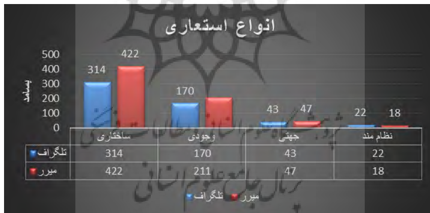
نمودار ۳. انواع استعاره‌های ساختاری، وجودی، جهتی و نظام‌مند در روزنامه‌های تلگراف و میرر