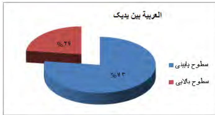
نمودار ۱: درصد کلی سطوح پایین و بالا در مجموعه العربية بين يديك