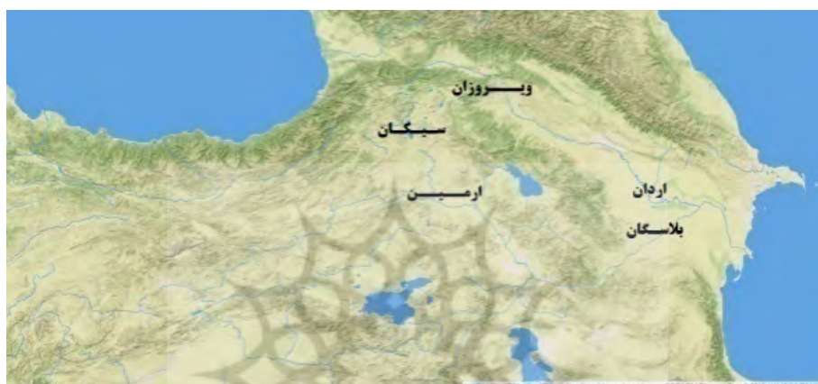
نقشه ۲. قلمرو ساسانیان بر اساس سنگ‌نبشته‌های سده سوم م.