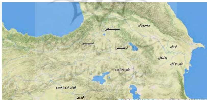
نقشه ۳. نواحی ساسانی در قفقاز جنوبی بر اساس مدارک مهرنگاری