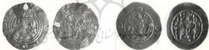
شکل ۱. سکه‌های خسرو یکم و خسرو دوم ضرب ارمین ۳

نام ارمینستان به صورت کوتاه‌شده‌ی ARM بر سکه‌های ساسانی دیده می‌شود. گوبل ۱ معتقد است که این نام هنوز قابل جایابی نیست و نظر هرتسفلد در مورد ارمینه را نیز به دلیل این که بدون توضیح خاصی ارائه شده نمی‌پذیرد. پاروک نخستین کسی بود که مونوگرام ARM را برای ارمینستان پیشنهاد کرد. ۲ این نام در سکه‌های بهرام پنجم (۴۲۰-۴۳۸ م.)، یزدگرد دوم (۴۳۸-۴۵۷ م.)، پیروز (۴۵۹-۴۸۴ م.)، بلاش (۴۸۴-۴۸۸ م.)، قباد یکم (۴۸۸-۴۹۶ م.)؛ ۴۹۹-۵۳۱ م.)، زاماسب، قباد دوم (۶۲۸-۶۳۰ م.)، خسرو یکم (۵۳۱-۵۷۹ م.)، هرمزد چهارم (۵۷۹-۵۹۰ م.)، خسرو دوم (۵۹۱-۶۲۸ م.)، اردشیر سوم (۶۳۰ م.) و یزدگرد سوم (۶۳۲-۶۵۱ م.) دیده شده است (شکل ۱).