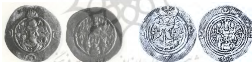
شکل ۲. سکه‌های پوراندخت ۲ و هرمزد چهارم ضرب ویروزان ۳

این مونوگرام را گوبل ۱ نامشخص و به احتمال در شمال یا شرق امپراتوری می‌داند. با توجه به سنگ‌نبشته شاپور یکم در کعبه زردشت می‌توان این نام را مورد بررسی قرار داد. در متن پهلوی به شکل 'wlwč'n، در متن پارتی 'wyršn، و در متن یونانی Iberias خوانده می‌شود. با توجه به متن پهلوی می‌توان آن را وروچان خواند که در واقع نام ساسانی گرجستان شرقی است. این نام در پایان دوره ساسانی بر روی گِل‌مُهرهای این دوره ویروزان نوشته شده است. نام این سکه‌خانه در سکه‌های خسرو یکم، هرمزد چهارم (۵۷۹-۵۹۰ م.)، اردشیر سوم و پوراندخت (۶۳۰ م.) دیده شده است (شکل ۲).