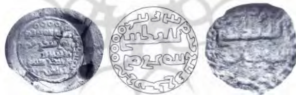
شکل ۸. استاندار ایران-ابزود - خسرو ۳