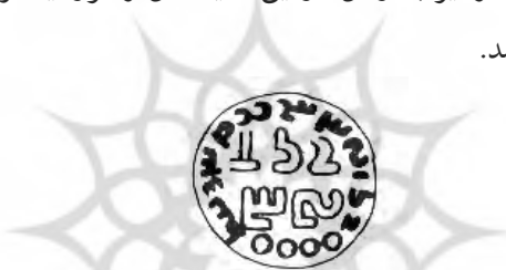
شکل ۹. استاندار ویروزان ۵

نام ویروزان توسط یک مهر استاندار شناخته می‌شود (شکل ۹). پیش از این با اردان روی یک مهر آمارگر (شکل ۴) و نیز با اردان، ارمین، سیسگان و مرز نیسوان روی یک مهر زربد (شکل ۳) مشاهده شد.