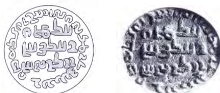
شکل ۴. گِل مُهر آمارگر اردان و ویروزان ۱