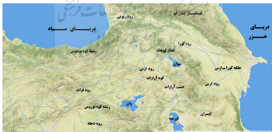
نقشه ۱. وضع ناهمواری‌ها و رودهای قفقاز جنوبی

بنابراین، همان‌طور که مشاهده می‌شود، قفقاز جنوبی سرزمینی بسیار کوهستانی است که با مرزهای کوهستانی خود از سایر مناطق جدا شده و شامل کشورهای آذربایجان، گرجستان، ارمنستان و شرق ترکیه امروزی است.