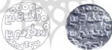
شکل ۳. گل‌مُهر زَرید با نام‌جای‌های ارمین، آردان، ویروزان، سیسگان و مرز نیسوان ۹

نام آردان همراه با نام ویروزان روی یک مُهر آمارگر (شکل ۴) و همچنین با ویروزان، ارمین، سیسگان و مرز نیسوان روی یک مُهر زَرید (شکل ۳) قرار دارد. ۸ نام ارمین را بر روی مُهرهای زربد و آمارگر، همراه با شهر پادار پیروز، بازاها، شهر موگان و کوست آذربادگان مشاهده می‌شود.