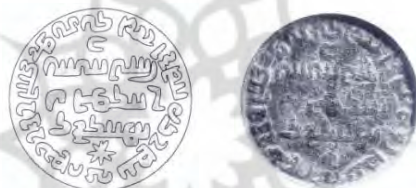
شکل ۵. گِل مُهر آمارگر آرمین و بازاها و شهر موگان و کوست آذربادگان ۳

این نام جای بر روی یک مُهر آمارگر (شکل ۶) همراه با شهر پادار پیروز، روی مُهر دیگری از آمارگر (شکل ۵) همراه با نام بازاها، شهر موگان و کوست آذربادگان، و همچنین با اردان، ویروزان، سیسگان و مرز نیسوان بر روی مُهری از زَرَبد آمده است (شکل ۳).