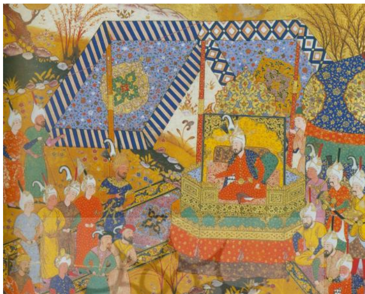
تصویر ۳: آوردن پسر سلطان مراد عثمانی در بز می نزد تیمور (رجبی، ۱۳۸۲: ۲۶).