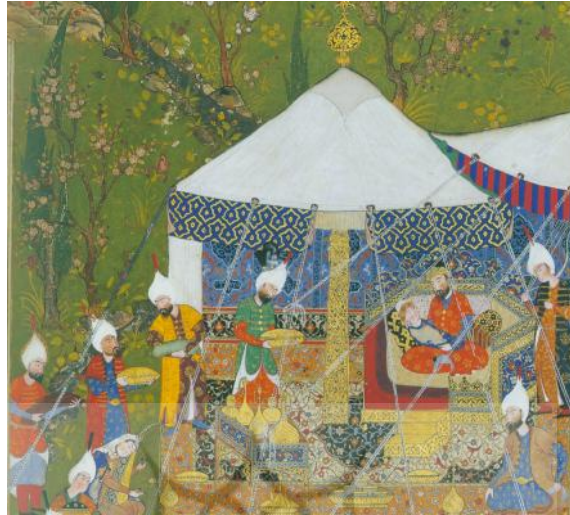
تصویر ۱: تفرجگاه تیمور در سمرقند (رجبی، ۱۳۸۲: ۲۲).