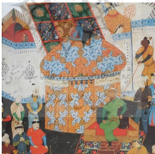
تصویر ۴: به تخت نشستن تیمور (سودآور، ۱۳۸۰: ۱۱۱).