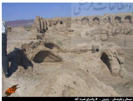
(شکل شماره ۷: رباط شوره گز، از سایت