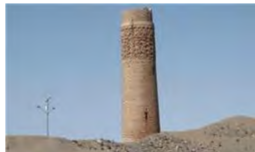
(شکل شماره ۴، میل نادری، از سایت (www.hamgardi.com)