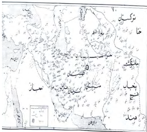
۱۱۷- نقشه قلمرو شاهنشاهی