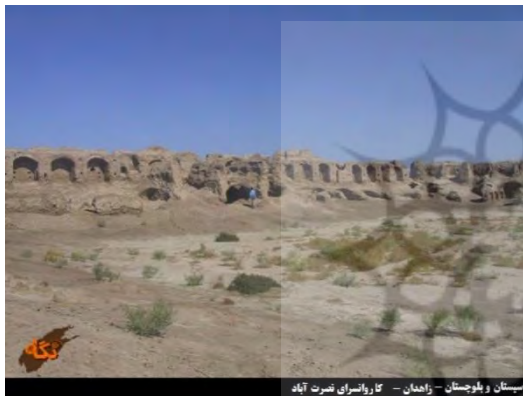
(شکل شماره ۶: رباط شوره گز، از سایت