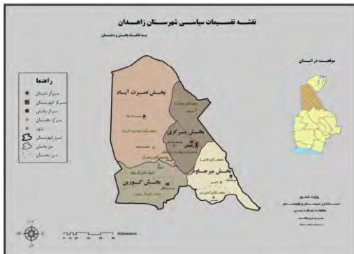
شکل شماره ۱

سایکس، سرپرسی (۱۳۷۸). جغرافیای تاریخی سیستان، (سفر با سفرنامه ها). «خاطرات سفر چهارم به ایران». ترجمه و تدوین حسن احمدی. تهران: حسن احمدی.