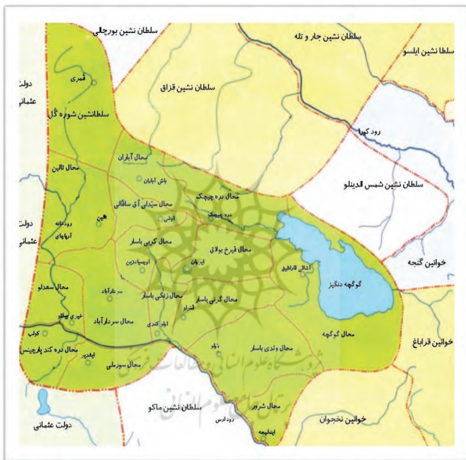
نقشه حکومت محلی خان‌نشین مسلمان ابروان