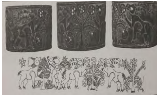
شکل ۱۳- اهمیت بزکوهی در برابر درخت، تصاویر کرکس زیر پای آن ها (مجیدزاده، میری، ۱۳۹۲: ۱۲۵)

اهمیت بیشتری دارد. وانگهی، گفته پرداز تصاویر کرکس ها را زیر پای این بزها ترسیم کرده است! شاید این درخت دلالت معنایی فرازمینی دارد! ژان دانیل فورست ۱ عقیده دارد که درون مایهٔ درخت الهی، درون مایه ای است که در تمدن های قبل از جیرفت وجود داشته است. با خوردن این درخت حیوان به جوهر الهی دست پیدا می کند و در ادامه انسلن با خوردن شیر این حیوان یا گوشت آن به همان جوهره می رسد. (مجیدزاده، میری، ۱۳۹۲: ۱۲۲ و ۱۲۵)