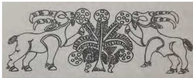
شکل ۸- نقش مایه منقور و مرصع بز و درخت با میوه انار (آقاعباسی، ۱۳۸۹: ۲۲۰)

صحنه مرغزار، به صورت گیاهان، علفزار، چمنزار به صورت نقش برجسته بر روی ظروف سنگ صابونی در منطقه جیرفت، تصویر شده‌اند. به طور مثال، تصاویر منقور حیوانات گیاه خور مانند بز، دارای چشم سنگ نشاند می‌باشند. همچنین، تصاویر منقور درختان میوه که این حیوانات در حال چریدن، خوردن و یا استراحت در میان آن‌ها هستند، نیز سنگ نشانی شده‌اند و میوه این درختان مرصع است. از جمله این درختان، می‌توان درختان اناری را مثال زد که بر روی ظرف استوانه ای ساخته شده از جنس صابونی، نقر شده‌اند و در دو سوی آن‌ها دو بز با شاخ‌های بلند در حال خوردن میوه‌های انار آن‌ها می‌باشند. تصاویر میوه انار این درختان، مرصع می‌باشند. انار، میوه ملی ایرانیان است و همواره نزد آنان مقدس بوده است، زیرا اعتقاد داشتند که یکی از میوه‌های بهشتی بر روی زمین است. بنابراین ما شاهد تصویری هستیم که در آن بز، حیوان ملی ایرانیان در حال خوردن انار، میوه ملی ایرانیان نشان داده است. (آقاعباسی، ۱۳۸۹: ۲۱۹)