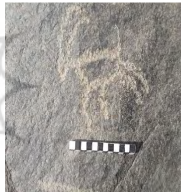
شکل ۱- بزکوهی با حالت پرش (نگارندگان)

درخت حک شده بر روی تپه شاه فیروز نقش استیلیزه سرو می باشد. این درخت هابه شکل مستقل حک شده است و در موارد اندکی در دو مورد در کنار بزها ترسیم شده اند.