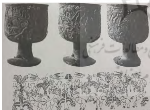
شکل ۱۲- اندازه طبیعی حیوان و درخت (مجیدزاده، میری، ۱۳۹۲: ۱۲۵)

همچنین تصاویری از درخت نخل ۱ بر روی ظروف سنگی جیرفت نقر شده اند. تصویر درختان نخل در نخلستان به همراه میوه های خرما بر روی یک تنگ مخروطی از جنس سنگ صابونی مکشوفه در جیرفت وجود دارد. (همان، ۲۲۱) رابطه حیوان با گیاه بیشتر تغذیه ای است. گیاه او را سیر می کند. این حالت یا به صورت طبیعی نشان داده شده یعنی گیاه در اندازه طبیعی خود است.