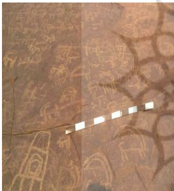
شکل ۲- مجموعه ای از بزهای کوهی (نگارندگان)

بزکوهی در روی تپه شاه فیروز به شکل انفرادی ترسیم شده است. و در مواردی تعداد زیادی از آن ها را می بینیم که گروهی نقش شده اند.