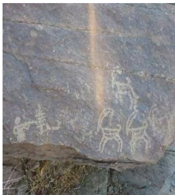
شکل ۴- دوسرو فرسایش یافته