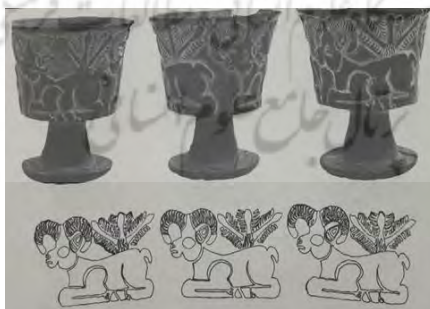
شکل ۷- تصویر بزرگی شاخ های بز (مجیدزاده، میری، ۱۳۹۲: ۱۱۷)

در بسیاری از آثار مکشوفه در جیرفت از جمله سفالینه های پیش از تاریخ به دست آمده در این منطقه، پیکره ها، اشیای مفرغین، مهره ها، الواح، ظروف سنگی و دیگر اشیای از جنس های گوناگون، نقوش انواع حیوانات دیده می شوند که هر کدام از این حیوانات می توانند نماد یا رمزی از نیروی حیات، باروری و عناصر کیهانی باشند. حیوان ها در این ظروف به دو گروه واقعی و تخیلی تقسیم می شوند. حیوان واقعی خود به اهلی و وحشی قابل تقسیم است. حیوان های اهلی از خانواده گاو، بز و گوسفندند. بز و گوسفند بیشتر از گاو دیده شده اند. بز و گوسفند به صورت گله ای هم دیده شده اند. بررسی شاخ های این حیوانات نشان می دهد که تقریباً از تمام سنین در میان آن ها دیده می شود. جنسیت آن ها به صورت خیلی روشن مشخص و حتی در نشان دادن آن اغراق شده است (چرا؟ به دلیل اهمیت آن ها؟ یا به دلیل اهمیت باروری؟ یا . . .). گفته پردازان این نقش مایه ها وقتی گاوها را در حالت نشسته به تصویر کشیده اند، آن ها را در حالتی ترسیم کرده اند که گویی آزاد هستند؛ ولی، در حالت ایستاده غالباً با چیزی بسته شده اند. چیزهایی که به پاهای آن ها بسته شده به طبیعت حیوانی آن ها بستگی ندارد. سر این حیوانات (گاوها) غالباً از نیم رخ نشان داده و شاخ های آن ها از روبرو ترسیم شده است. گاهی هم این حیوانات اهلی به صورتی تصویر شده اند که گویی یال های آن ها را شانه کرده اند و بلندی یال های آن و بزرگی شاخ های آن ها به صورتی است که گفته خوان نوعی عزم و اراده را در آن ها می بیند. تصویر (مجیدزاده، میری، ۱۳۹۲: ۱۱۵)