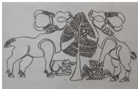
شکل ۹- دو بز در حال خوردن درخت سرو (آقاعباسی، ۱۳۸۹: ۲۲۸)

همچنین تصاویری از درخت نخل ۱ بر روی ظروف سنگی جیرفت نقر شده اند. تصویر درختان نخل در نخلستان به همراه میوه های خرما بر روی یک تنگ مخروطی از جنس سنگ صابونی مکشوفه در جیرفت وجود دارد. (همان، ۲۲۱) رابطه حیوان با گیاه بیشتر تغذیه ای است. گیاه او را سیر می کند. این حالت یا به صورت طبیعی نشان داده شده یعنی گیاه در اندازه طبیعی خود است.