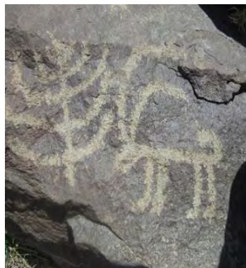
شکل ۳- درخت سرو (نگارندگان)