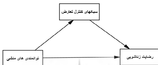
شکل ۱: مدل روابط مفروض میان متغیرهای توانمندی‌های منشی، سبک‌های کنترل تعارض و رضایت زناشویی

بنا بر شواهد و قرائن فوق، پژوهش حاضر درصدد بوده است تا نقش توانمندی‌های منشی را در پیش‌بینی رضایت زناشویی مورد بررسی قرار دهد؛ این پژوهش، سبک‌های کنترل تعارض بین فردی را به عنوان واسطه‌ای در نظر گرفته که نقش توانمندی‌ها را در رضایت زناشویی تبیین می‌نماید. بر اساس طرح بارون و کنی ۴۵ (۱۹۸۶)، مدل کلی که برای بازنمایی روابط فوق فرض می‌شود به قرار زیر است.