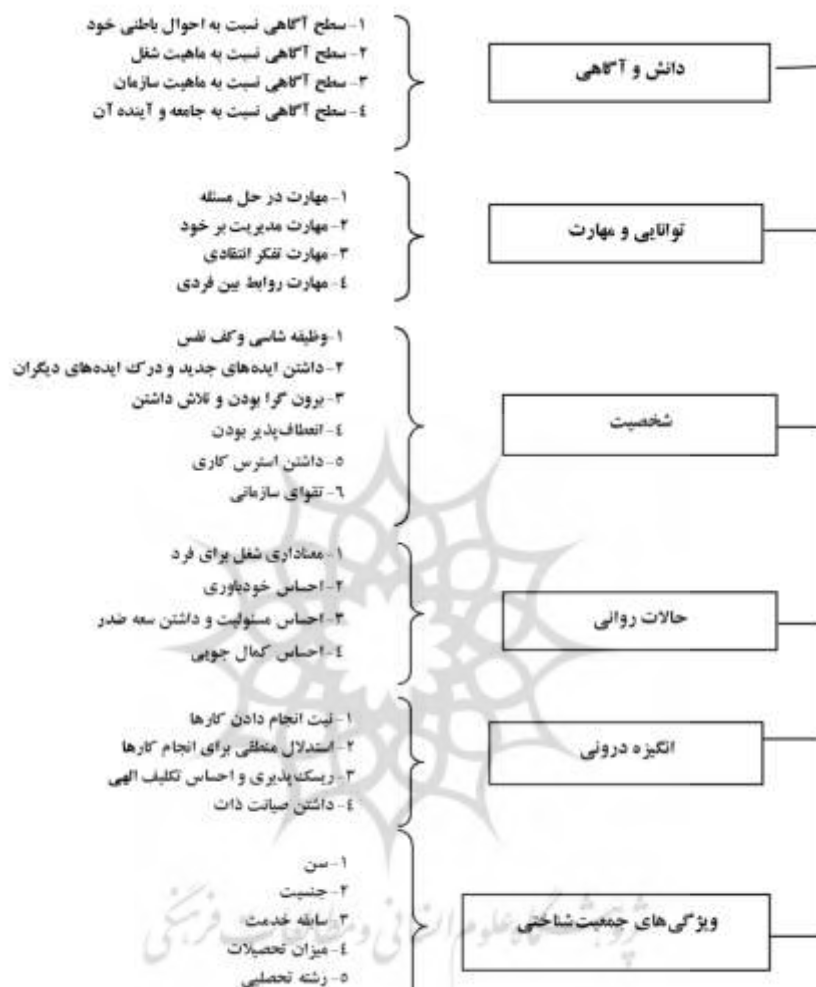
شکل شماره ۱. مدل مفهومی تحقیق