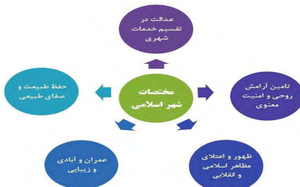
شکل(۳): مشخصات شهر اسلامی

استاد احمد اشرف در خصوص سیمای شهرهای اسلامی می گوید: «شهرهایی که فرمانروایان اسلامی بنیان گذاردند دو پایه اصلی داشت: یکی مسجد جامع و دیگری بازار. بنای مسجد جامع به عنوان مرکز روحانی شهر و منطقه زیر نفوذ آن، در محل مناسبی در کنار شاهراه اصلی، در محوطه بزرگ مستطیلی شکلی، بنا می شد. در کنار مسجد جامع مرکز اصلی دولتی جای داشت که قرارگاه فرمانروا یا نایبان آن بود. در سوی دیگر مسجد جامع و گاهی گردادگرد آن بازارها قرار داشتند(اخوت، الماسی فر، بمانیان، ۱۳۸۹: ۷۲).