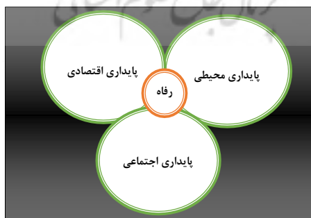
شکل (۲) انواع پایداری برای تامین آسایش و رفاه پایدار

به علت تمرکز پیوسته روبه رشد جمعیت و فعالیت های اقتصادی در مراکز شهری، به ویژه در کشورهای کمتر توسعه یافته، پایداری توسعه شهری بیشتر مورد توجه قرار گرفته است (drakakis-smit, 1995). شهر پایدار شهری است که به دلیل استفاده اقتصادی از منابع، اجتناب از تولید بیش از حد زایعات، بازیافت مواد زاید تا حد امکان قادر به ادامه حیات خود باشد. شهر پایدار جانشین موجه و معقول برای شهرسازی مخرب قرن بیست است و در آن به موازات توجه به مسائل زیست محیطی و مسائل اجتماعی و انسانی نظیر مسکن مناسب و زندگی حداقل نیز توجه می شود (بحرینی، ۱۳۷۶ ص ۲۸/۲۹). شهر پایدار شهری است که در آن سه شرط اساسی زیر درست باشد: