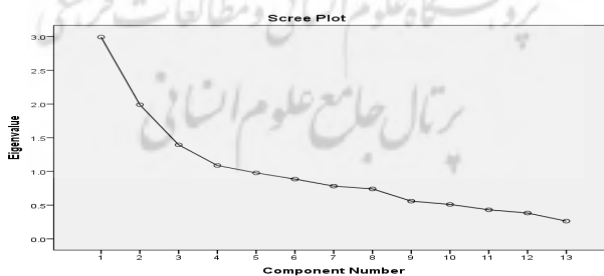
نمودار 2. نمودار سنگریزه (آزمون اسکری) تعداد عوامل مربوط به حافظه

یکی از دیگر روش‌های تعیین تعداد عوامل استفاده از نمودار سنگریزه (آزمون اسکری) است. نمودار 2 نشان می‌دهد که دو عامل قابل استخراج است.