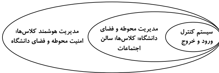
شکل ۱. ایجاد ارزش افزوده خدمات الکترونیکی از طریق سیستم کنترل ورود و خروج، مدیریت فضا جهت امنیت محوطه و فضای دانشگاه (Wu et al., 2011)

کارت‌های هوشمند ۱ در زندگی روزانه به طور گسترده‌ای به کار می‌روند، از قبیل پرداخت‌های الکترونیکی، حمل و نقل، مراقبت‌های پزشکی از راه دور، اوقات فراغت و بالاخص آموزش و یادگیری (Lee et al., 2003). کارت‌های هوشمند و الکترونیکی که در دانشگاه‌ها به کار می‌روند، فرصت مناسبی را برای ترویج و به کارگیری فن آوری کارت هوشمند ایجاد می‌کنند. برنامه‌های کاربردی کارت هوشمند را می‌توان به چند دسته تقسیم کرد: ۱. کارت دانشجویی به عنوان هویت‌یابی ۲ ، ۲. کارت ورودی برای کتابخانه‌ها، ورود به ساختمان‌ها، پارکینگ و سلف سرویس و ۳. کیف الکترونیکی ۳ برای پرداخت پول (Lee & Yang, 2000). اوایل دهه قرن بیست و یکم با تغییرات سریع در وابستگی متقابل بازار جهانی، بیداری و وحدت اجتماعی و پا به عرصه گذاشتن نسل جوان، به عنوان عامل کلیدی این تغییرات در سطوح اجتماعی، اقتصادی و سیاسی همراه بود. در این دوره، اینترنت و فن آوری‌های نوین به عنوان سوخت و کاتالیزور ۴ این وقایع محسوب می‌شدند و تا حد زیادی به ایجاد تغییرات بنیادین در رویکرد سنتی علوم و آموزش کمک کردند (Greenberg & Zanetis, 2012).