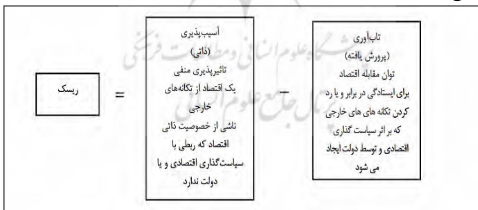
شکل ۱- مدل تأثیر تاب‌آوری و آسیب‌پذیری در ریسک تخریب اقتصاد ملی،