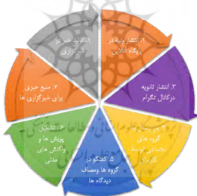
شکل ۲- توصیف فراگرد تعامل رسانه‌های جمعی (پایگاه آنلاین) و شبکه‌های اجتماعی (کانال تلگرام) سه خبرگزاری در تولید و توزیع خبر و پوشش‌های اجتماعی

خبرگزاری‌ها نموده و سپس پیرامون آن خبر به بحث و گفتگو در گروه‌ها و صفحات اجتماعی می‌پردازند، که از این طریق جریان‌ها و پوشش‌های اجتماعی شکل می‌گیرد. بنابراین از این دو منظر رسانه‌های اجتماعی و رسانه‌های جمعی (مانند پایگاه آنلاین این سه خبرگزاری) به نوعی از هم افزایی رسیده‌اند، و خبرگزاری‌ها و مطبوعات همچنان از مراکز اصلی تولید جریان خبری در شبکه‌های اجتماعی هستند. همچنین در ادامه این فراگرد شبکه‌های اجتماعی و مباحث مطرح شده در آن یکی از منابع تولید خبر در رسانه‌های جمعی است و این چرخه تشکیل یک الگوی تعامل بین رسانه‌های جمعی و شبکه‌های اجتماعی را می‌دهد که در بررسی سه خبرگزاری ایسنا، فارس و صداوسیما در این پژوهش این فراگرد کاملاً مشهود بود.