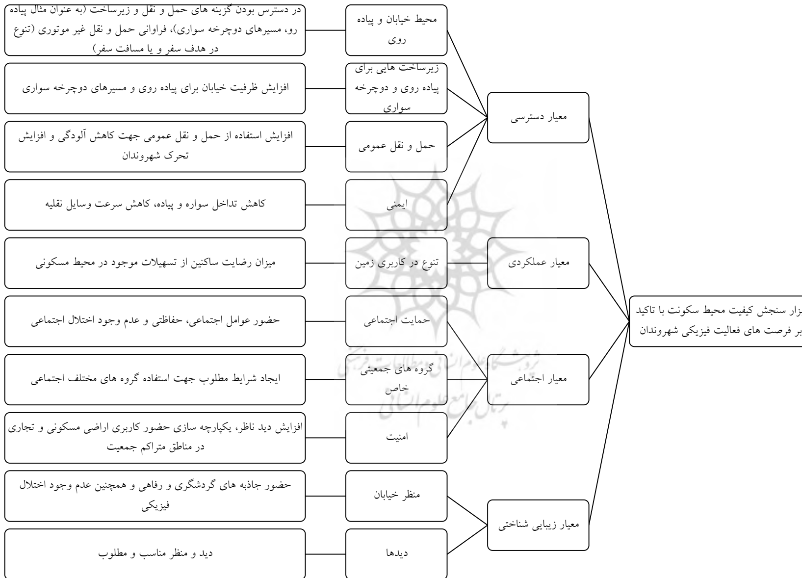
شکل (۱): مدل مفهومی پژوهش