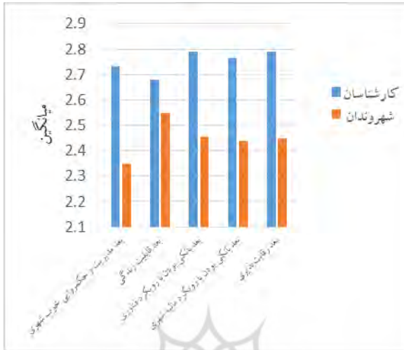
شکل (۴): میانگین شاخص‌های مدل CDS در شهر ایلام از نگاه کارشناسان و