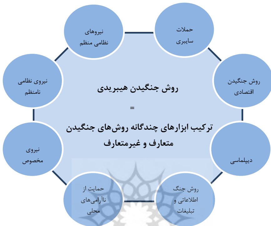
شکل ۲: روش جنگ هیبریدی از نظر کنفرانس امنیتی مونیخ

«طی دهه گذشته، ایالات متحده آمریکا همراه با متحدان بین‌المللی خود بر توان مقابله با تهدیدات نامنظم ناشی از بازیگران غیردولتی تا حد بسیاری افزوده است، اما طی همین سال‌ها یک چالش متمایز علیه آمریکا و شرکای این کشور در ناتو و حتی دیگر کشورها به واسطه ترکیب جدیدی از حملات نامنظم به وجود آمده است؛ این چالش جنگ هیبریدی با ترکیبی از ابزارهای متعارف، نامنظم و نامتقارن است. جنگ هیبریدی شامل استفاده یک بازیگر دولتی یا غیردولتی از همه ابزارهای در دسترس دیپلماتیک، اطلاعاتی، نظامی، اقتصادی با هدف ایجاد بی‌ثباتی در کشور هدف است.» (سایت چاهاراه، ۱۳۹۳).