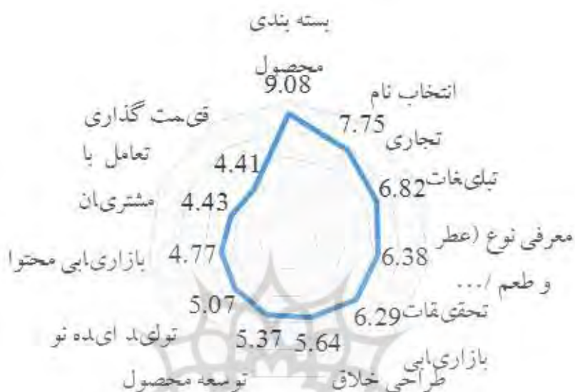
شکل ۲- تأثیر جمع‌سپاری بر فعالیت‌های بازاریابی

در شکل ۲، نمودار تار عنکبوتی تأثیر جمع‌سپاری بر هریک از فعالیت‌های جمع‌سپاری به تصویر کشیده شده است. همان‌گونه که از نمودار برمی‌آید، جمع‌سپاری