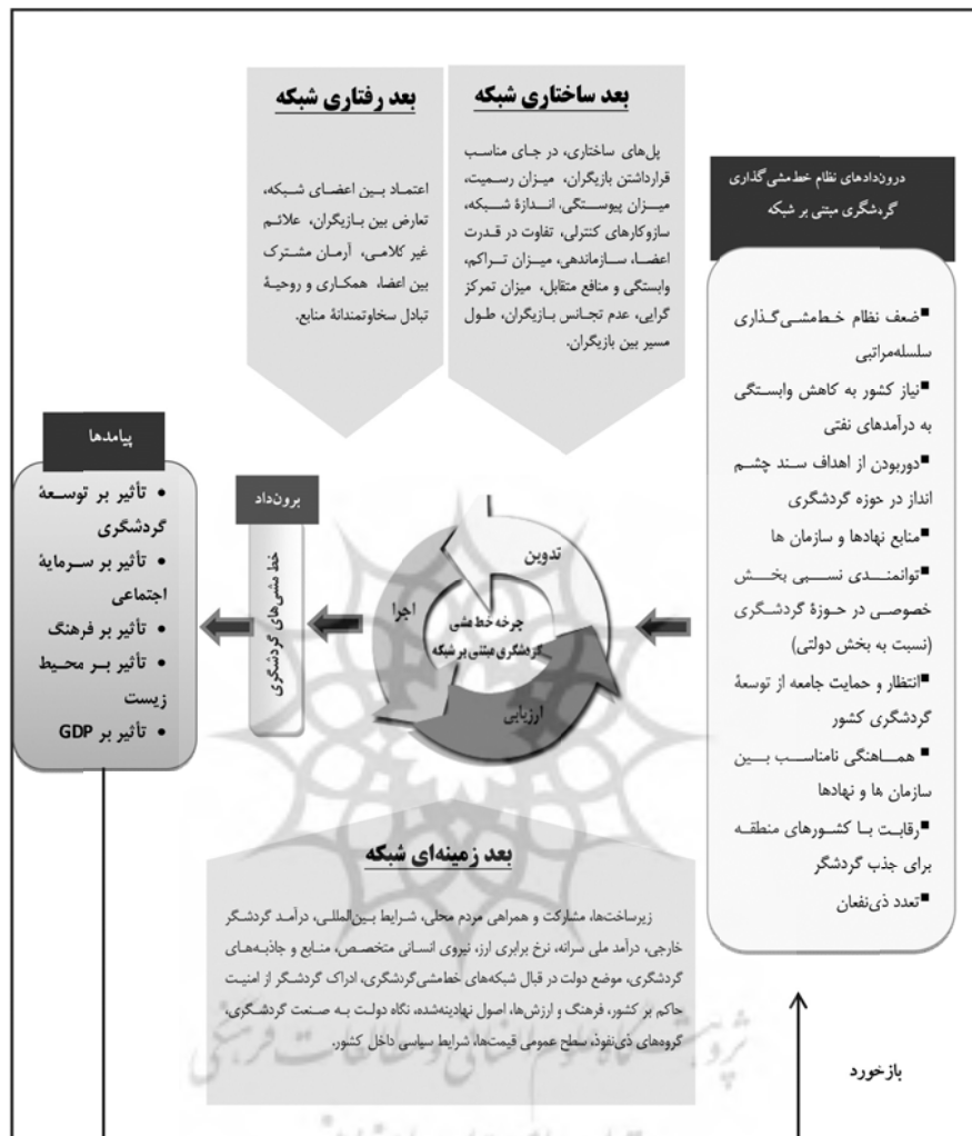
شکل ۱. مدل خط‌مشی‌گذاری شبکه‌ای در حوزه گردشگری

در ادامه، مدل اولیه طراحی شده، اعتباربخشی شد. همان‌طور که در جدول ۳ مشاهده می‌شود، به غیر از پنج مؤلفه، مقادیر بارهای عاملی استانداردشده سایر مؤلفه‌ها برای همه سازه‌های تحقیق مناسب است (بارهای عاملی یا همان ضریب همبستگی بین متغیرهای مکنون و مشاهده‌شده، بیش از ۰/۳ مناسب است). بنابراین، پنج مؤلفه یادشده نیز از مدل مفهومی حذف شدند.