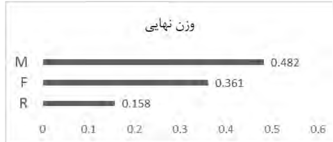
نمودار ۲: وزن نهایی هر یک از شاخص‌های مدل RFM