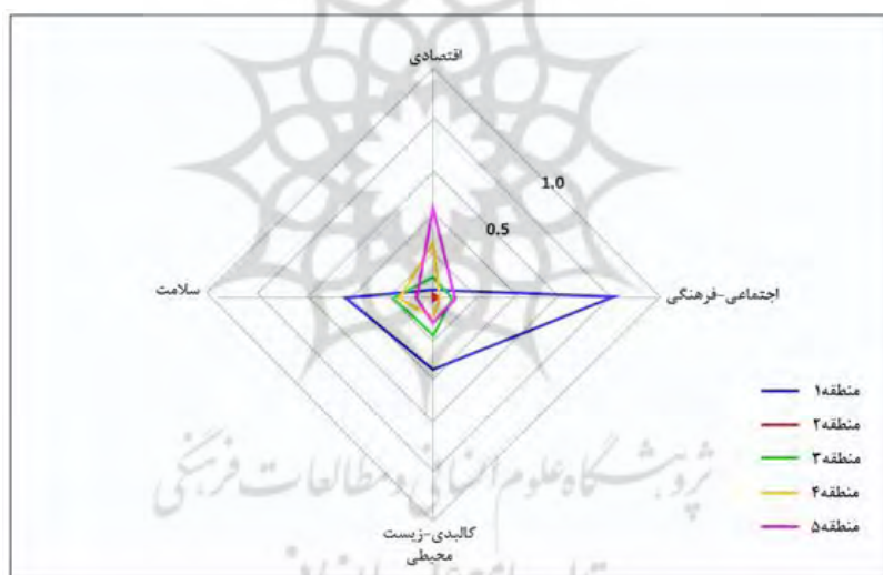
شکل (۳): امتیاز مناطق ۵ گانه در ابعاد زیست پذیری

جداول و اشکالی که از طریق پیاده‌سازی داده‌ها بر روی مدل انتخابی تحقیق به دست آمده؛ نشان دهنده این است که منطقه ۱ در بعد اقتصادی نسبت به سایر ابعاد، امتیاز کمتری را کسب کرده است و در بعد اجتماعی-فرهنگی بیشترین امتیاز را داراست. منطقه ۲ نیز بیشترین و کمترین امتیاز را به ترتیب در بعد اجتماعی-فرهنگی و سلامت بدست آورده است. نکته قابل تامل در رابطه با این منطقه کسب امتیازات پایین در تمامی ابعاد زیست‌پذیری است، شرایط زیست‌پذیری منطقه ۳ نیز حاکی از این است که در بعد کالبدی-زیست محیطی و سلامت؛ امتیازاتی تقریباً در یک رده (۰.۵۹، ۰.۰۵۶) و در ابعاد اجتماعی-فرهنگی و اقتصادی (۰.۲۴، ۰.۰۲۷، ۰.۰۲۳) نیز وضع به همین منوال است.