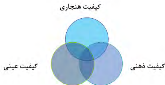
شکل (۱): مولفه‌های زیست‌پذیری ۲۰۱۱، (City Life: Rankings (Livability)). Source:

با این اوصاف موسسه مرسر فهرست کاملی از مولفه‌های زیست‌پذیری را در سال ۲۰۰۶ منتشر کرده است که طبقه‌بندی اصلی آن عبارتند از: محیط سیاسی و اجتماعی، محیط اقتصادی، محیط فرهنگی _ اجتماعی، ملاحظات پزشکی، بهداشتی و سلامت، مدارس و آموزش، تفریح و سرگرمی، کالاهای مصرفی، مسکن، خدمات عمومی و سیستم حمل‌ونقل و محیط طبیعی (Mercer Human Resource Consulting).