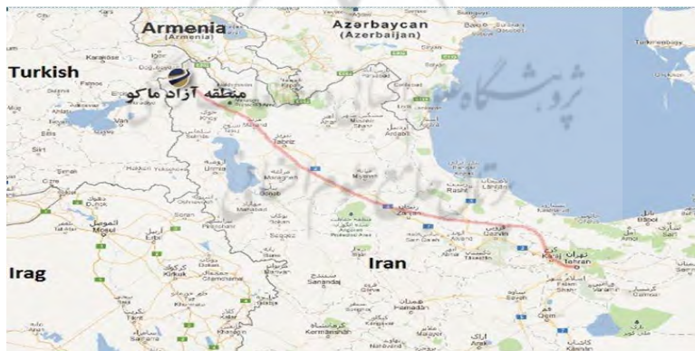
شکل شماره (۲): موقعیت منطقه آزاد تجاری - صنعتی ماکو در منطقه

منطقه آزاد تجاری - صنعتی ماکو در شمال غرب کشور، شامل شهرهای ماکو، بازرگان، شوط و پلدشت و مساحتی بالغ بر ۵۰۰ هزار هکتار، با عنوان هفتمین منطقه آزاد تجاری و اقتصادی کشور، با برخورد از ظرفیت‌های اقتصادی قابل توجه و امکانات زیربنایی مناسب و حاکمیت مجموعه‌ای از قوانین و مقررات ویژه حمایتی، فرصت‌های قابل توجهی را پیشروی سرمایه‌گذاران داخلی و خارجی در زمینه‌های اقتصادی و گردشگری فراهم نموده است؛ این منطقه از موقعیت استثنایی در حمل و نقل و ترانزیت کالا بواسطه ی اتصال به بازارهای اروپا و آسیای میانه برخوردار است. به طوری که، از شمال به جمهوری ترکیه، از شرق با مرز آبی ارس به جمهوری خود مختار نخجوان محدود است که این موقعیت، منطقه را بعنوان شاه راه ارتباطی ترانزیت کالاهای کشورهای آسیای میانه و اروپا بعنوان مهمترین شاخص تجارت جهانی مطرح نموده است. منطقه آزاد ماکو در زمینه گردشگری نیز غنی می‌باشد. ایوان فرهاد (در ۷ کیلومتری ماکو)، عمارت کلاه فرنگی، کاخ باغچه جوق، گرمابه تاریخی ماکو، بافت قدیم ماکو (قلعه قبان)، سد پناهکنندی، کلیسای زور زور، رودخانه مرزی ارس، چشمه ثریاتنها گوشه‌ای از جاذبه‌ها و زیبایی‌های گردشگری در منطقه آزاد ماکو می‌باشد. در شکل (۲)، موقعیت منطقه آزاد ماکو و مرزهای آن مشخص شده است.