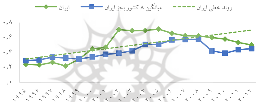
نمودار (۳) - مقایسه ایران با میانگین ۸ کشور در شاخص آسیب‌پذیری اقتصادی