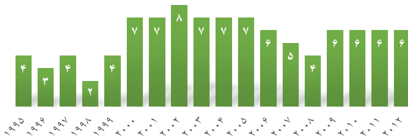
نمودار (۲) - رتبه ایران در شاخص آسیب‌پذیری اقتصادی در بین کشورهای منتخب