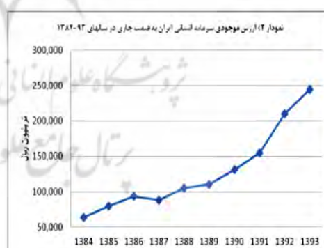
مأخذ جداول (۲)

بر اساس ستون‌های ماقبل آخر جداول (۴) و (۵) به ترتیب نمودارهای (۲) و (۳) ترسیم شده‌اند. در حالی که بر اساس نمودار (۲) ارزش موجودی سرمایه انسانی ایران در طی