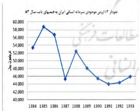
مأخذ جدول (۳)